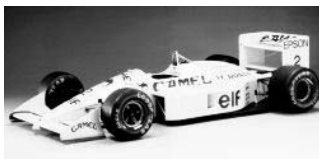
デモ走行が予定されている ロータス100T

1987年、日本人初のフルタイムF1ドライバーとなった中嶋悟氏。世界の強豪が集うF1、その中で中嶋氏は、忘れることの出来ない数々の思い出をファンに残してくれた。その中嶋氏が1988年にドライブしたロータス100Tを、自らの手でドライブする予定だ。