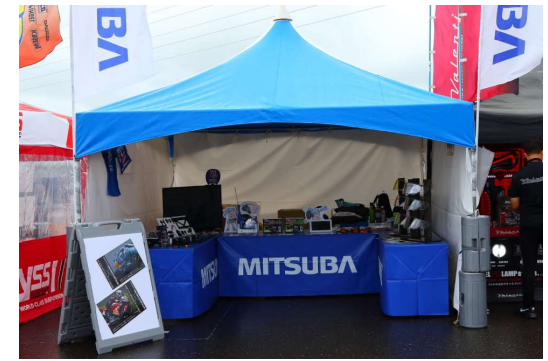
ミツバサンコーワ