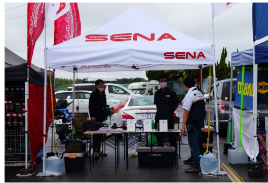
セナブルトゥースジャパン