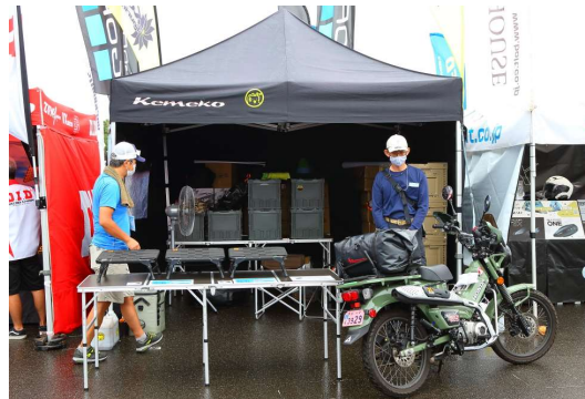
KEMEKOキャンピングシステム