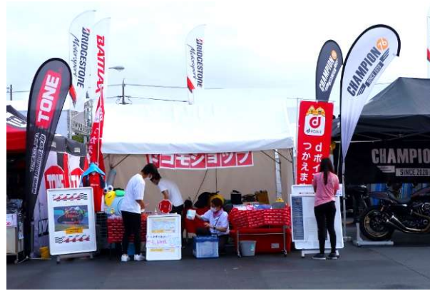
ドコモショップ サークット通り店