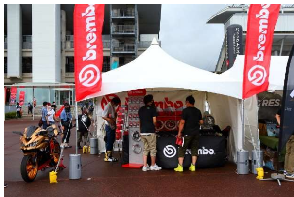
ブレンボジャパン