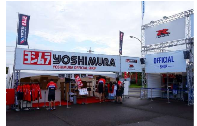
ヨシムラジャパン