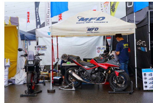
モトフィールドドッカーズ (MFD)