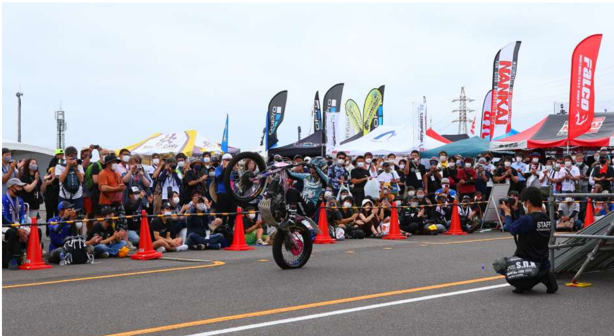
NANKAIビレッジ トライアルパフォーマンス