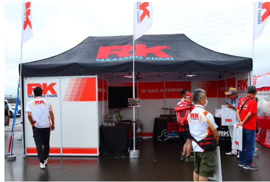
アールケー・ジャパン