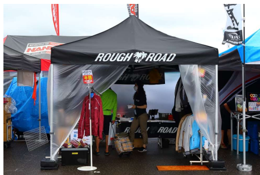
ラフアンドロードスポーツ