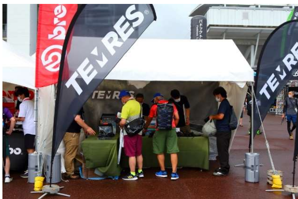
ショーワグローブ