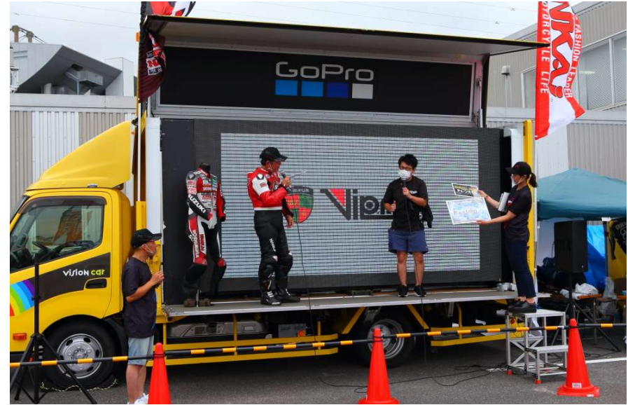
NANKAIビレッジ オフィシャルステージ