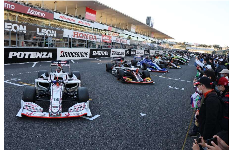
【JAF会員限定】ストレートパルクフェルメ先行入場