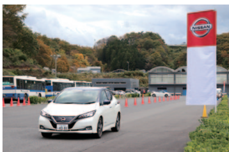
アクティブセーフティトレーニングパークで行われたNISSAN 新型リーフの試乗会。その先進技術をご体験いただきました。