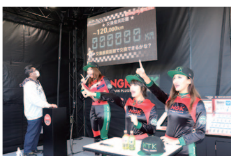
スパークプラグ交換距離と同じ数字を出してステキな賞品がプレゼントされるゲーム「Change de スパーク!」が行われたNGKブース。