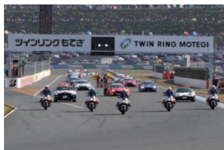
交通安全啓発活動の一環として、決勝スタート前に栃木県警の白パイとパトカーがSUPER GTマシンを先導してのパレードを実施しました(11日)。