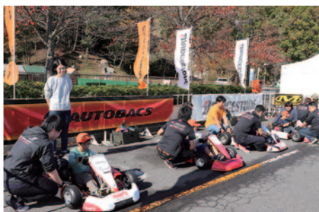
中央エントランスで行われた「キッズカート教室」。親子でレーシングカートの運転方法などを学んでいただきました。