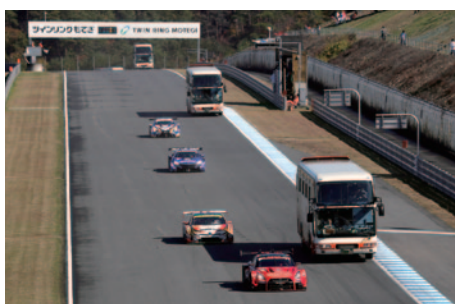
SUPER GTマシンの疾走する姿をバスの車内から間近に体験いただいた「サーキットサファリ」(10日)。