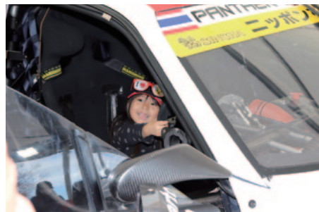
SUPER GTブースで行われたGT300マシン(arto RC F GT3)の Cockpit体験。