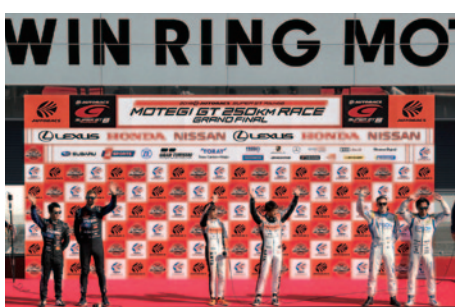
決勝スタート前に行われた「オールドライバーズアピアランス」。各チーム・選手がピット前からのライブ映像、さらに予選上位3チームの選手はボディウム登壇にて紹介されました(11日)。