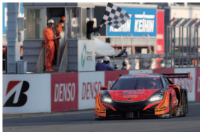
GT500ウイナー ARTA NSX-GT