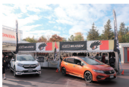
無限ブランドのスペシャルパーツ装着車の展示が行われたM-TECブース。