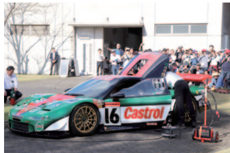
2000年にHondaが初めて全日本GT選手権でシリーズチャンピオンを獲得したホンダ カストロール無限NSXのエンジン始動(Honda Collection Hall)。