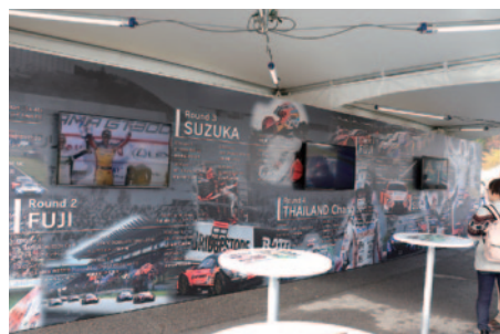
写真パネルや映像での2018シーズンの振り返りや優勝予想投票が行われた「グランドファイナルゾーン」(中央エントランス)。