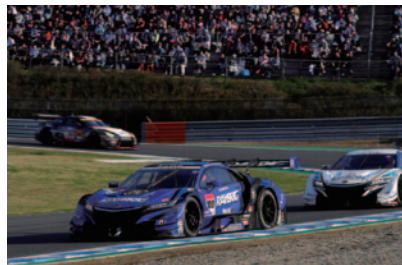
GT500チャンピオン RAYBRIG NSX-GT