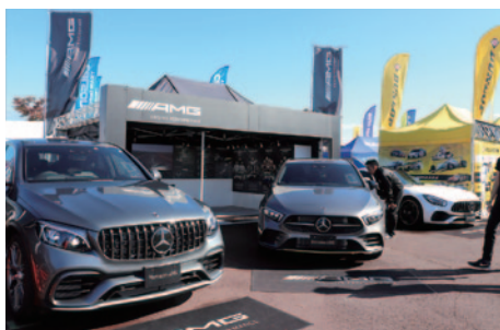
AMGブランドのニューモデルが展示されたAMGブース。