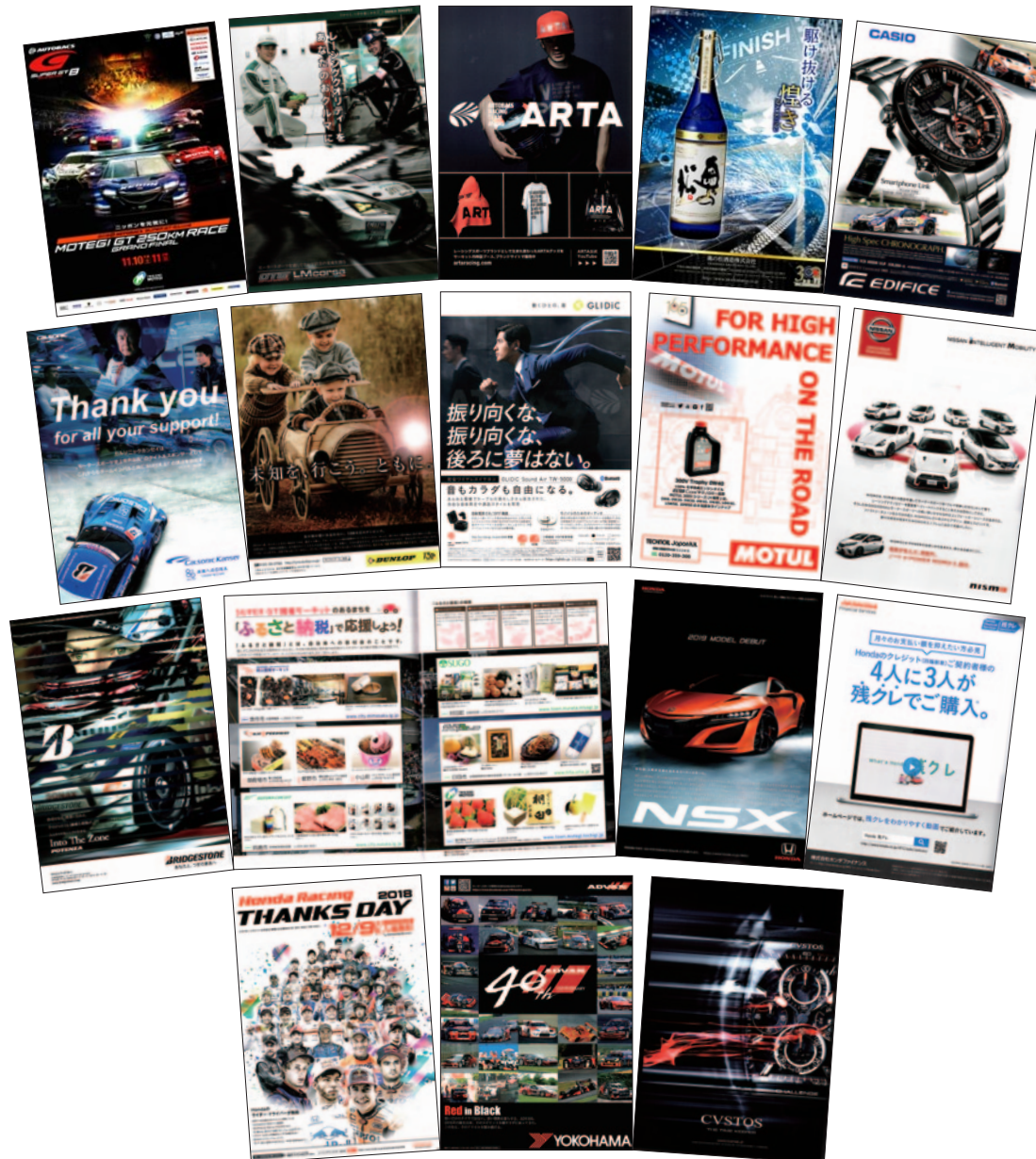
A4 カラー 84p 17,000部発行

大阪トヨペット株式会社 株式会社オートバックスセブン 奥の松酒造株式会社 カシオ計算機株式会社 カルソニックカンセイ株式会社 住友ゴム工業株式会社