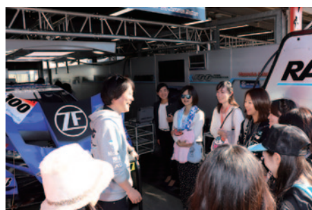
女性限定でTEAM KUNIMITSUのピットを訪問いただいた「LOVE GT PIT TOUR」(10日)。