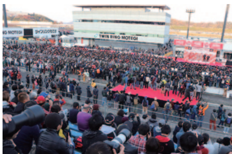
表彰式に続いてホームストレート特設ステージで行われた「グランドフィナーレ」。全ドライバーが登場して、ファンに対して一年の感謝の気持ちを伝え、プレゼントの投げ込みなどが行われました(11日)。