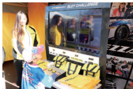
スロットゲームにチャレンジいただき、同一ブランドを3つそろえるとオリジナルグッズがプレゼントされたDUNLOPブース。