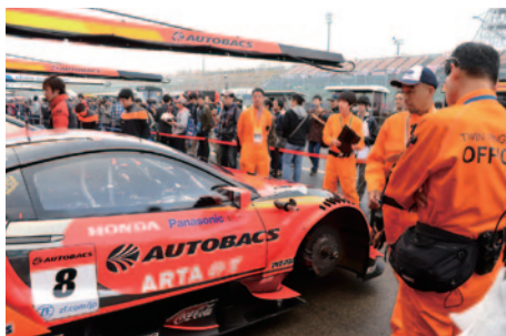
ピットウォークスタイルで行われた公開公式車検「オープンピット」(10日)。