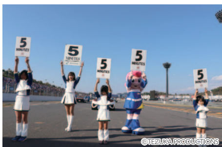
決勝スタート前のカウントダウンボード掲出体験「ツインリンクもてぎエンジェルシスターズ!!〜レーススタート直前のカウントダウンボードアップ〜」(10・11日)。