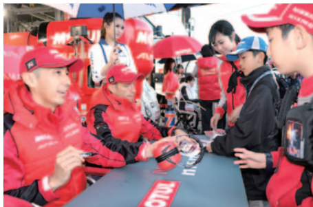
公式予選終了後に行われた「キッズピットワーク」。中学生以下のお子さまと同伴者の方に無料で楽しみいただきました(10日)。