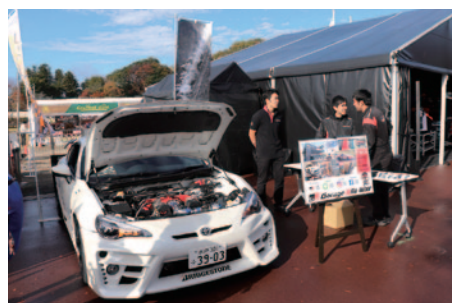
86/BRZ、FIA-F4選手権、スーパー耐久などのレース活動紹介が行われたGR Garage水戸インターブース。