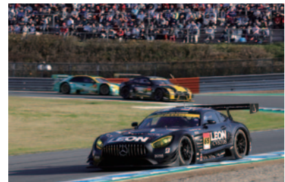
GT300ウイナー/チャンピオン LEON CVSTOS AMG