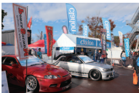
音源からスピーカーまで完全デジタル再生。車載用フルデジタルサウンドシステムの試聴体験が実施されたクラリオンブース。