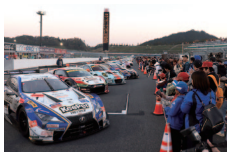
決勝レースを終えたコースを開放、マシンの保管場所「パークフェルメ」の間近までお入りいただいた「パークフェルメワーク」(11日)。