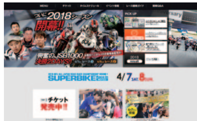
ホームページ制作