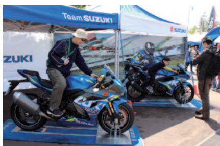
ニューマシンの展示・搭乗体験などが行われたSUZUKIブース(グランドスタンドプラザ)。