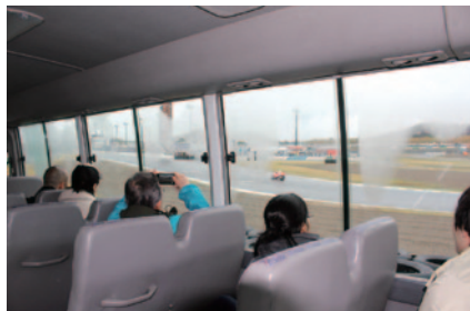
ロードコースのサービスロード(コースサイドの運営車両通路)をガイド付きバスでご体験いただいた「ガイド付きサービスロードバスツアー」。女性専用の回も設けられました。