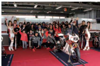
トップチームのピットを見学、スタッフからの解説やライダーとふれあっていただいた「ピット訪問ツアー」(7日…MORIWAKI MOTUL RACING 8日…MuSASHi RT HARC-PRO Honda (写真))。