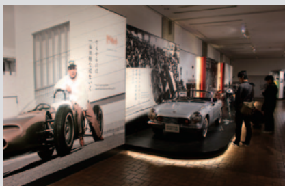
Honda Collection Hall開館20周年を記念した新展示「Honda 夢と挑戦の軌跡」。Honda創業者、本田宗一郎と藤澤武夫の原点と歩みをたどります(1階)。

PICK UP 3 今年、開館20周年を迎えたHonda Collection Hallでは、さまざまな特別展示やイベントが行われました。