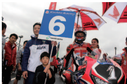
JSB1000クラス決勝スタート前のグリッド上でライダーとマシンをエスコートいただいた「JSB1000グリッドキッズ」。