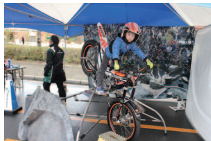
本物のトライアルバイクでウイリーやジャックナイフの迫力をご体験いただいた「なりきりトライアルライダー」(中央エントランス)。