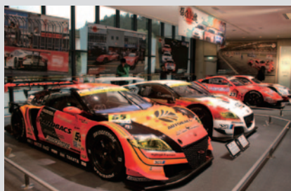
Honda Collection Hall開館20周年を記念したリクエスト展示「群雄割拠 ～SUPER GTの覇車たち～」国内随一の人気を誇るマシンが一堂に(2・3階 6月13日(水)まで)。