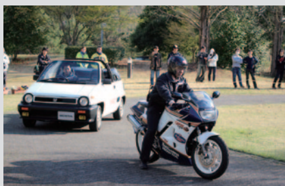
Honda Collection Hall所蔵車のデモンストレーション走行をご覧いただいた「WEEKEND RUN」(中庭)。シティカプリオレ(1985 写真左奥)、VFR400R(1988 写真左手前)、VF1000R(1984 写真右)、アキュラMDX(2001)が登場しました。