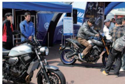
ニューマシンの展示・搭乗体験などが行われたYAMAHAブース(グランドスタンドプラザ)。