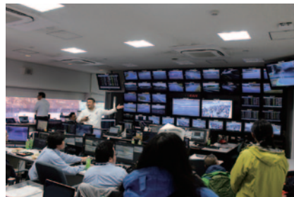
女性限定で行われたプレミアム体験、レース運営の中枢「コントロールルーム」解説付き見学ツアー。監視モニターTV操作もチャレンジいただきました。