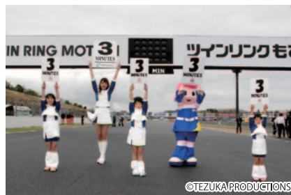
各クラス決勝スタート直前のカウントダウンボードをツインリンクもてぎエンジェルと一緒にご掲出いただいた「ツインリンクもてぎエンジェルシスターズ!! スタート直前のカウントダウンボードアップ〜」。

PICK UP 2 各日のスケジュール終了後は、ロードコースをパレード走行でお楽しみいただきました。