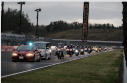
MotoGP™の熱戦が展開されるロードコースをマイバイクでパレード走行いただいた「MotoGP™プレイベント グランプリコースパレード」(7日)。

PICK UP 2 各日のスケジュール終了後は、ロードコースをパレード走行でお楽しみいただきました。