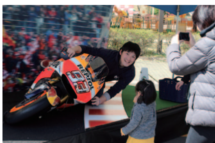
本物のMotoGP™マシンの60°のバンク角をご体験いただいた「なりきり! MotoGP™ライダー」(中央エントランス)。