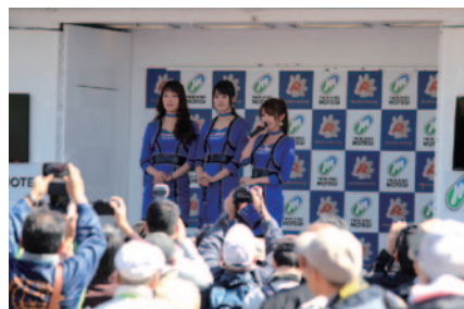
各チームのキャンペーンガールが一堂に会した「全日本ロードレース キャンギャルオンステージ」(8日 グランドスタンドプラザオフィシャルステージ)。