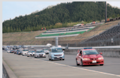
マイカーでロードコースをパレード走行いただいた「全日本ロードレース ファミリーパレード」(8日)。