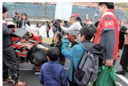
各クラス決勝スタート前のグリッドにお入りいただき、その緊張感を味わっていただいた「コチラレーシングのキッズグリッドウォーク」。