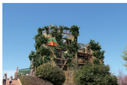
今年3月、モビパークに新登場した「森感覚アスレチックDOKI DOKI」。巨大などんぐりの木に見立てられた高さ13m・5階建ての木登り型アスレチックです。

PICK UP 3 今年、開館20周年を迎えたHonda Collection Hallでは、さまざまな特別展示やイベントが行われました。