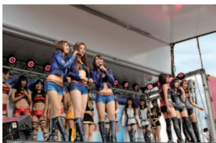
各チームのレースクイーンが一堂に会した「レースクイーンステージ」。