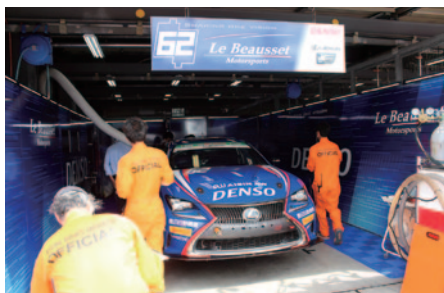
ピットワーク中に実施された「公開車検」(22日)。