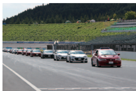
先着150台を対象に決勝レース直前のレーシングコースを愛車でパレードいただいた「みんなでスーパー耐久ファミリーパレード」(23日)。