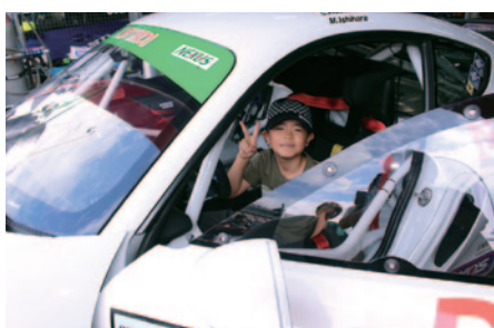
多くのチームご協力のもとピットワーク時に実施された「お子さま限定! マシン搭乗体験」(23日)。