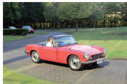
Honda Collection Hall所蔵車両のデモンストレーション走行「WEEKEND RUN」。今回はS500(写真…1964年)、パラードスポーツCR-X(1983年)、プレリユード(1987年)、シビックタイプR(1997年)が登場しました。