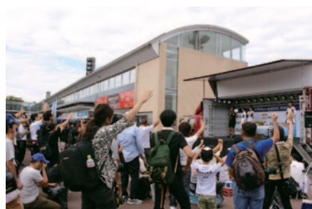
各チームに持ち寄っていただいた豪華賞品をかけて盛り上がった「じゃんけん大会」(23日)。