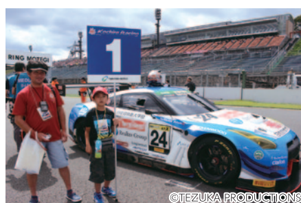
決勝レーススタート直前の緊張感あふれるコース上でマシンをエスコートしていただいた「グリッドキッズ」(23日)。