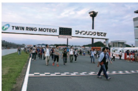
決勝レース終了直後のホームストレートを開放、熱戦の余韻をお楽しみいただいた「ホームストレートワーク」(23日)。