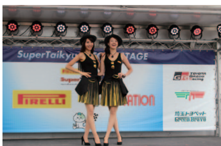
スーパー耐久マシンの足元を支えるピレリのイメージガール「Pirelli Girl」によるPRステージ。