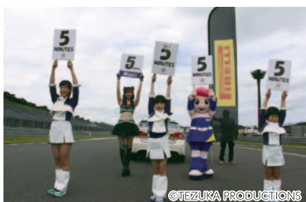
決勝レーススタート直前のコース上で、スタート前のカウントダウンボードを掲げていただいた「ツインリンクもてぎエンジェルシスターズ! ~レーススタート直前のカウントダウンボードアップ~」(23日)。