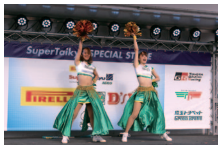
チアリーダーによるパフォーマンスで盛り上がった「埼玉トヨペットGreen Brave」のPRステージ(23日)。