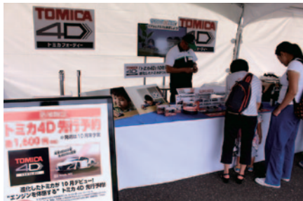
手のひらでエンジンのサウンドと振動を体感できる「トミカ4D」の先行販売が行われた中央エントランス特設ブース。