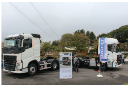
中央エントランスに展示されたボルボとUDのトラック。