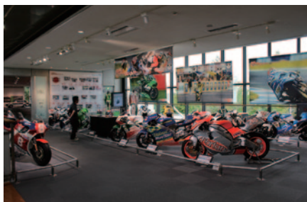
1990～2000年代に日本人ライダーが駆った世界GP/MotoGP™マシンが集結、熱狂を再現したHonda Collection Hall特別展示「熱狂を巻き起こした日本人ライダーたち」(12月10日(月)まで)。