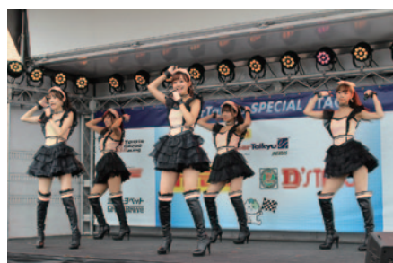
スーパー耐久公式イメージガール「フレッシュエンジェルス」によるミニライブ。