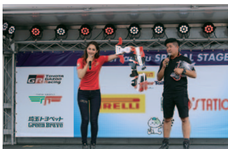
レアもののペーパークラフトなど、貴重な賞品がプレゼントされた「TOYOTA GAZOO Racing PRステージ」(23日)。