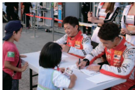
中学生以下のお子さまと保護者の方に無料で楽しんでいた「キッズピットワーク」(22日)。