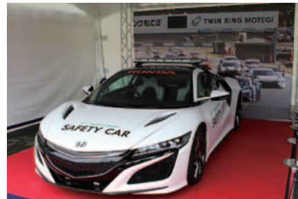
鈴鹿サーキットのセーフティーカーとして活躍する新型Honda NSXが展示された中央エントランス特設ブース。