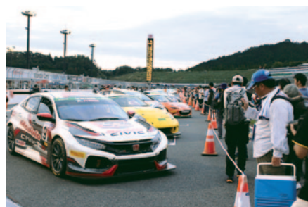
決勝レースの激戦を終えたばかりのマシンを保管するエリア「パークフェルメ」。その間近までアクセスいただいた「パークフェルメワーク」(23日)。