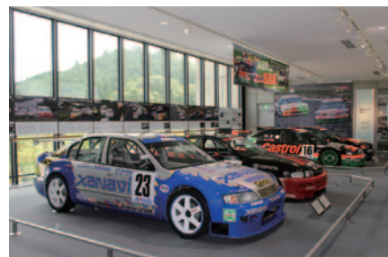
4ドアセダンマシンによる激戦のJTCC(全日本ツーリングカー選手権)。HondaのチャレンジをたどったHonda Collection Hall特別展示「34連敗からの挽回劇 JTCCシビック&アコード挑戦記」(12月10日(月)まで)。