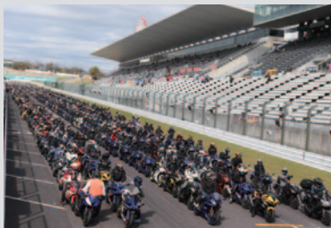
今年20周年を迎えたYAMAHA YZF-R1をはじめとする「YAMAHA YZF-R全国ミーティング」(3日)。

人気車種のオーナーズクラブ様によるGPスクエアでの展示や国際レーシングコースのパレード走行が日替わりで行われました。