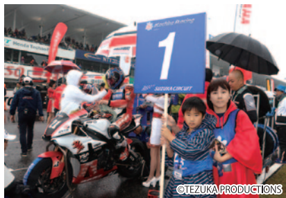
コチラレーシングファンクラブ会員の中から抽選で選ばれた方に、JSB1000クラスのスターティンググリッドでライダーとマシンを迎えていただいた「JSB1000! グリッドキッズ」(4日)。