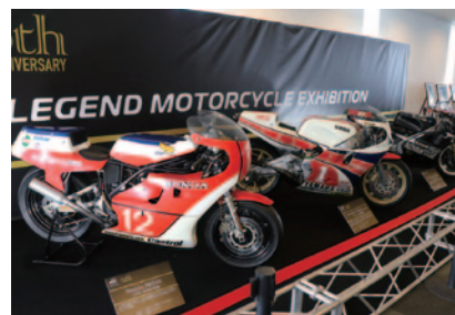
歴史を彩った名車をパドック内センターハウスに展示した「レジェンドマシンエキシビジョンルーム」。左からHonda NR500(1982)、YAMAHA YZR500(1984)、SUZUKI RG-F500(1989)。