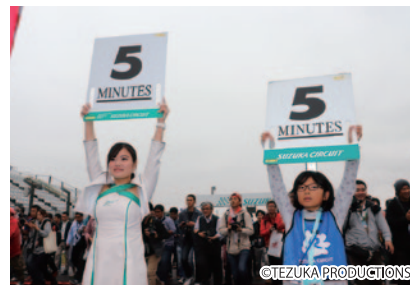
コチラレーシングファンクラブ会員の中から抽選で選ばれた女の子に、JSB1000クラススタートまでのカウントダウンボードを掲げていただいた「JSB1000! カウントダウンボードアップ」(4日)。