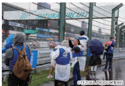
JSB1000クラス決勝スタートの瞬間を“激近”な場所から体感いただいた「激近! スタート体験」(4日)。