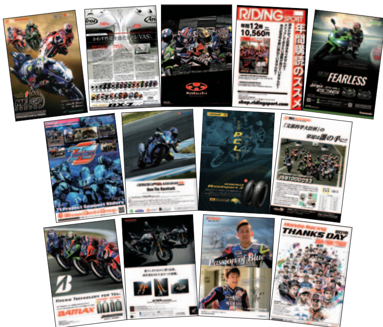
A4 カラー 52p 9,000部発行

株式会社アライヘルメット 住友ゴム工業株式会社 株式会社オージーケーカブト 一般財団法人日本モーターサイクルスポーツ協会(MFJ) 株式会社オフィスとらくしよん 株式会社ブリヂストン 株式会社カワサキモータースジャパン 株式会社ホンダモーターサイクルジャパン 昭和電機株式会社 ヤマハ発動機販売株式会社 株式会社スズキ二輪 Honda Racing THANKS DAY 2018