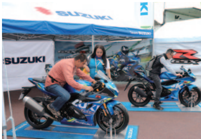
ニューモデルの展示・搭乗体験が行われたSUZUKIブース。