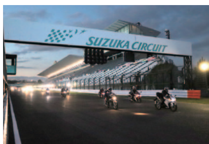
予選・決勝各日のレーススケジュール終了後、夕闇の国際レーシングコースをマイバイクで体験走行いただいた「サーキット ナイトクルージング」。