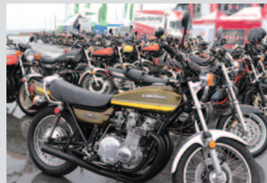
初代Z1から最新型Z900RSまで、Kawasaki Z&ゼファーによる「Kawasaki Z &ゼファーミーティング」(4日)。