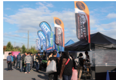
バイク関連グッズ・カスタムパーツの会社・ショップに多数ご出展いただいた「ライダーズビレッジ」。