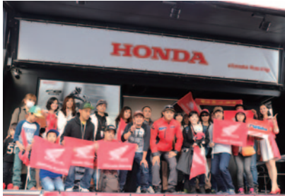
サイン会や記念撮影など高橋巧選手とファンの交流(3日)が行われたHondaブース。

4クラスすべてがチャンピオン決定戦となった全日本ロードレース選手権最終戦「第50回MFJグランプリ」。グランドスタンド手前のGPスクエアでは、パートナー各社様の華やかなプロモーションやイベントなどが展開されました。