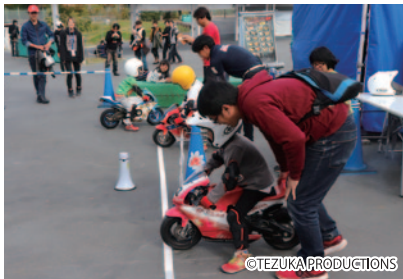
レース用のエンジン付きポケバイのライディングを親子で体験いただいた「親子バイクチャレンジ」。