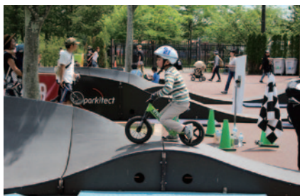
新たなパンプトラック「スピードリンク」が登場! 2つ並んで配置されたコースを使ったバトルをご体験いただいた「ストライダー パンプバトル」(グランドスタンドプラザ)。