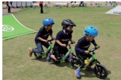
3人乗りができるストライダー「ムカデくん」。チームで力を合わせてゴールを目指していただいた「ストライダー ムカデくんレース」(中央エントランス)。