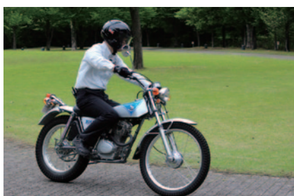
Honda Collection Hall所蔵車両によるデモンストレーション走行「WEEKEND RUN」。今回はトライアルバイク「バイアルス TL125」(写真 1972年)をはじめ4台の2輪が紹介されました。