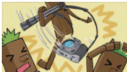
■カメラのレンズを振り回さない!