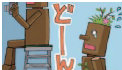
■脚立の使用は、後ろを気にして!