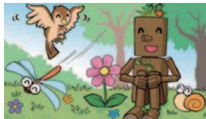
■森の生物を大切に!