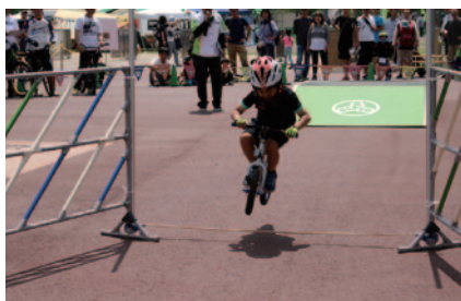
誰がいちばん高く飛べるかな?! ハイジャンプNo.1決定戦「バニーホップコンテスト」(グランドスタンドプラザ)。