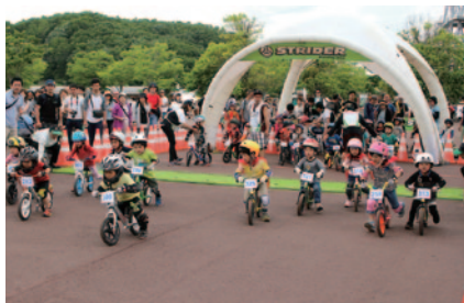
レースデビューに最適な公式レース「ストライダー エンジョイカップ」。頂点をめざして720台以上のエントリーを集め、年齢別に熱い戦いが繰り広げられました(グランドスタンドプラザ)。

2歳から乗れるランニングバイクとして人気を博している「ストライダー」。ストライダージャパン様に冠スポンサーとしてご協賛いただいて3年目を迎えた今回は、ストライダー10周年を記念した限定イベントなどがグランドスタンドプラザを中心に華やかに展開されました。