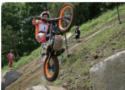
ボウはDAY2はラガに僅差で勝利