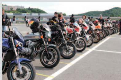
CBオーナーズミーティング 主催:株式会社ホンダモーターサイクルジャパン