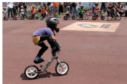
ストライダーを使ったオリジナルパフォーマンスを競っていた「トリックコンテスト」(グランドスタンドプラザ)。