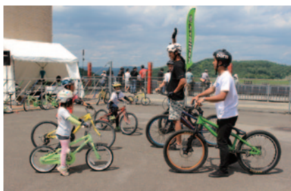
トライアル的な乗り方など一歩踏み込んだ自転車の世界をプロの講師がレクチャーした「ワンランク上の自転車教室」(グランドスタンドプラザ)。