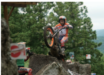
DAY1で圧勝したボウ 11連覇へ好調をキープ