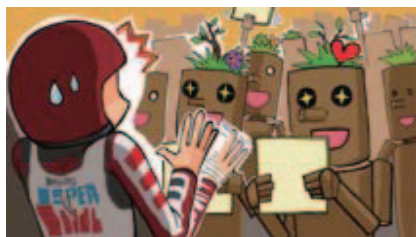
■サインを無理矢理ねだらない!