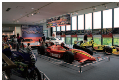
2002～2007年に内外のレースシーンで活躍したライバルマシンが一堂に会した「ツインリンクもてぎ開業20周年特別展示 Racing History Last 20 Years【Part 2】2002-2007」(9月6日まで Honda Collection Hall)。