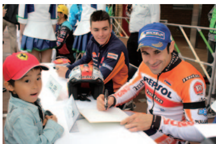
DAY1終了後に実施された恒例のライダーサイン会。トップライダー達が多くのファンと交流しました(中央エントランス)。