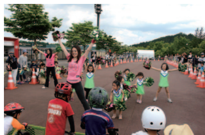
「ストライダー エンジョイカップ」スタート直前、参加者にエールを送っていただいた可愛いチアガールの皆さん(グランドスタンドプラザ)。