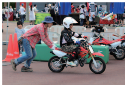
小学校低学年のお子さまと保護者の方にバイクの乗り方と楽しさを体験いただいた「親子バイク体験会」。(グランドスタンドプラザ)。