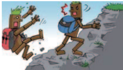
■ケガをしないように気をつけよう!

マナーを守って気持ちよく!ご来場いただいたすべてのお客さまに自然の中のトライアルを楽しんでいただけるよう「トライアルマナーアップキャンペーン」を実施、公式プログラムやサーキットビジョンでの紹介や場内実況での呼びかけを行いました。