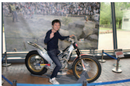
トライアルライダー気分を味わっていただいたトライアルマシン搭乗体験(Honda Collection Hall)。