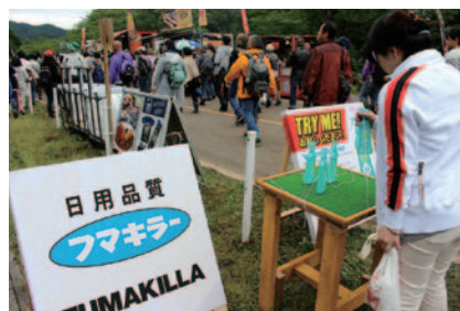
フマキラー製虫除け「スキンベープ」のサンプルリングがポディウム、No.4、8、15セクション付近で実施されました(会場各所)。