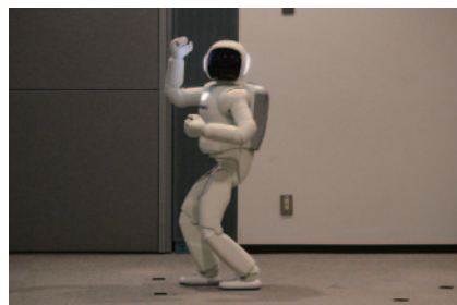
HondaのロボットASIMO(写真)や新たなパーソナルモビリティUNI-CUBのさまざまな機能をご覧いただいた「ASIMOスーパーライブ」(Honda Collection Hall)。