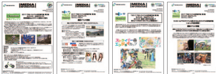
プレスリリース 2月27日(月) プレスリリース 4月7日(金) プレスリリース 5月2日(火) プレスリリース 5月25日(木)

5月8日(月)～21日(日) Google ディスプレイ ネットワーク(GDN)