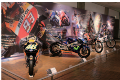
開業からの歴史紹介と、ツインリンクもてぎでのビッグレースで活躍した2輪・4輪のHondaレーシングマシンを集めた「ツインリンクもてぎ開業20周年特別展示～次なる未来へ～」(12月31日まで Honda Collection Hall)。