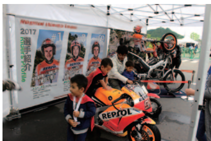
ワークスマシンから入門モデルまで、トライアル、MotoGP™ などオフ&オンのレーシングマシンの展示・搭乗体験などが行われたHRCブース(セクション入場ゲート手前)。