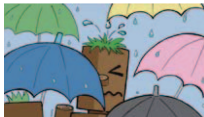
■雨天時の傘の使用はモラルを持って!