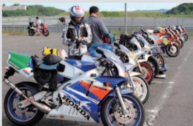
AREA NSR 主催:株式会社内外出版社

PICK UP 3 28日(日)には、Honda NSR、そしてHonda CBシリーズのオーナーを対象としたイベントが開催されました。