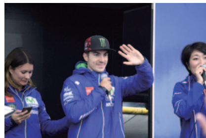
YAMAHAブースで行われたマーベリック・ビニャーレス選手(MOVISTAR YAMAHA MotoGP)のトークショー。