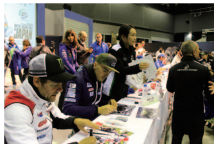
抽選で選ばれた1,000名のファンを対象に13日(金)に実施されたMotoGP™ライダーサイン会。