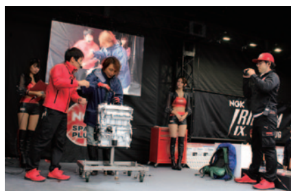
NGKブースで行われたスパークプラグ交換体験。