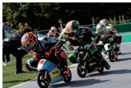
大会直前の12日(木)に行われた、モビパーク内アトラクション「モトレーサー」でのMotoGP™ライダーらによる模擬レース。