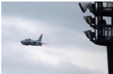
15日(日)MotoGP™決勝レース直前に行われた航空自衛隊百里基地第7航空団 所属「T-4」による歓迎フライト展示。