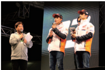
REPSOL HONDA TEAMのトーク。左からマルク・マルケス選手、ダニ・ペドロサ選手。