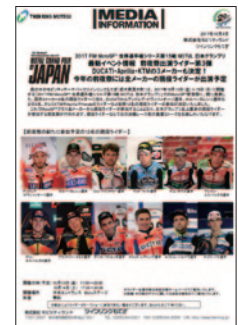
プレスリリース 10月4日(水)