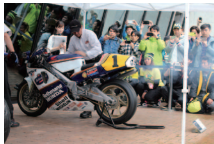
Honda Collection Hallで行われたレーシングマシンエンジン始動パフォーマンス。写真はHonda NSR500(1989)。