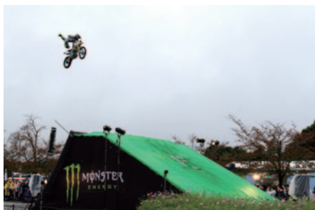
中央エントランスの特設会場を舞台に驚愕のパフォーマンスを披露したMONSTER ENERGY presents FMX (フリースタイルモトクロス) パフォーマンス。