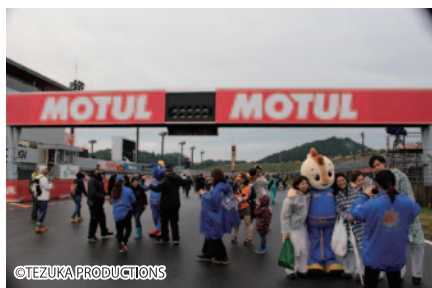
決勝レースの余韻さめやらめロードコース上を歩いてご体験いただいた「コースウォーク」。