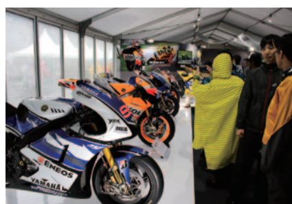
ツインリンクもてぎ20年の歴史を彩ったWGP、MotoGP™が一堂に展示された「ツインリンクもてぎ20th特別企画展示「ALL STAR」～ Best recommend MotoGP™ Machines ～」(ホスピタリティガーデン)。