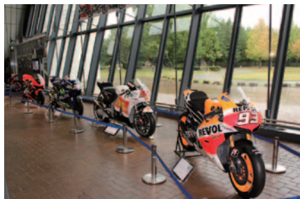
Honda Collection Hallで行われているHondaの歴代MotoGP™マシン展示「Honda RC213V-Sへの系譜」(12月11日(月)まで)。