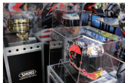
SHOEIブースに展示された、マルク・マルケス選手(REPSOL HONDA TEAM)の実物ヘルメット。