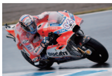
MotoGP™クラス 優勝したアンドレア・ドヴィツィオーゾ