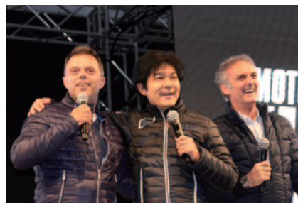
チャンピオンを獲得したレジェンドたちのトーク。左からロリス・カピロッシ氏、原田哲也氏、フランコ・ウンチーニ氏。