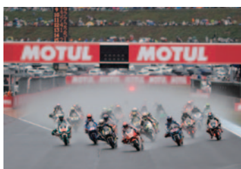
Moto2™クラス スタートシーン