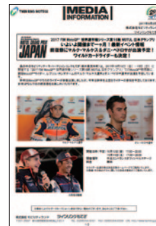
プレスリリース 9月8日(金)