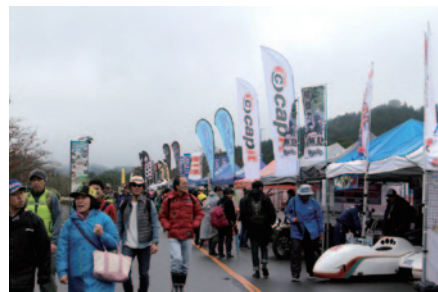
カスタムバイク、アフターパーツのメーカー、ショップが一帯に会した「カスタムビレッジ」。