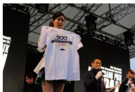
MotoGP™ライダーのプレミアムグッズが出品された「チャリティオークション」。収益金は日本赤十字社を通じて東日本大震災被災者への義援金として役立てられます。