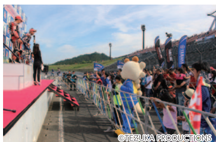
中学生以下のお子さまとそのファミリー限定でステージ間近で表彰式をご覧いただいた「表彰式ファミリーエリア」(29日)。