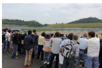
パドック入場可能なパスをお持ちの方を対象に、コース間近で最高峰の走りをお楽しみいただいた「激感エリア」。