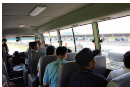
ロードコースのサービスロード(運営車両用通路)をガイド付きバスでご体験いただいた「ガイド付きサービスロードバスツアー」(29日)。