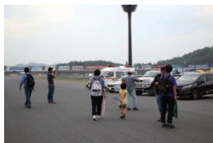
決勝レース終了後、ロードコース上を歩いて熱戦の余韻を体感いただいた「家族みんなでコースウォーク」(29日)。