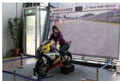
“コカ・コーラ ゼロ”鈴鹿8耐仕様レーシングマシンにまたがれるフォトコーナー(ホンダコレクションホール 1階ロビー)。

PICK UP 3 恒例となった「週刊バイクTV」(千葉テレビ)とのコラボ企画「週刊バイクTV杯 勝手にツーリングアワード」。今年はステージイベント(写真左)に加えて、場内でキャンプを楽しめる方を対象としたステイイベントにもご協力いただきました。