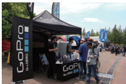
話題のウェアラブルカメラなどの商品展示と販売が行われたGoProブース(グランドスタンドプラザ)。