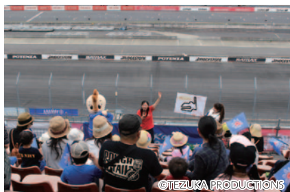
コチラと一緒にレースをわかりやすく解説!「コチラファンクラブ限定! スペシャル観戦シート(28日 グランドスタンドA席)。