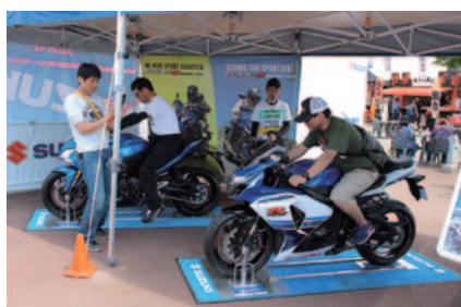
ニューモデルの乗車体験が行われたSUZUKIブース(グランドスタンドプラザ)。