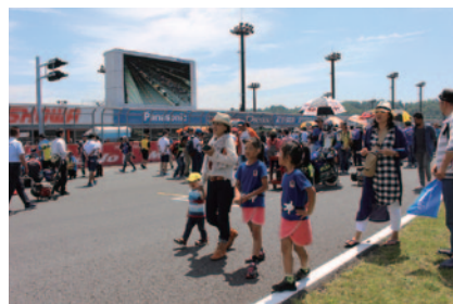
各クラス決勝スタート前のグリッドにご招待。その緊張感を味わっていただいた「コチラレーシングのキッズグリッドウォーク(29日)。