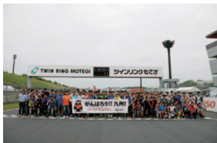
ライダーたちがコース上に集合、4月に被災された熊本の皆様に向けてエールを送りました(28日)。