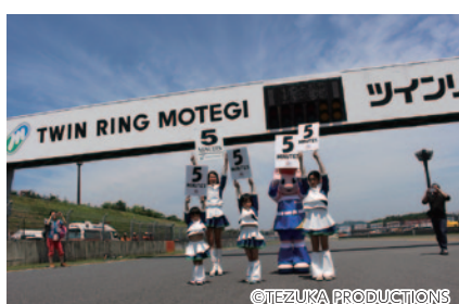
各クラス決勝スタート直前のカウントダウンボードをツインリンクもてぎエンジェルと一緒に掲げていただいた「なりきりエンジェルスペシャル!」(29日)。