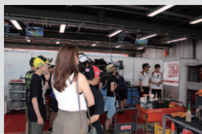
MuSASHi RT ハルク・プロのピット訪問を実施、ライダー・監督・スタッフとふれあっていただきました。