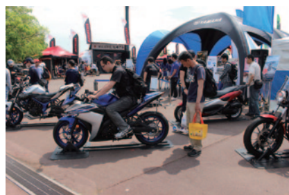
ニューモデルの乗車体験やライダートークショーが行われたYAMAHAブース(グランドスタンドプラザ)。