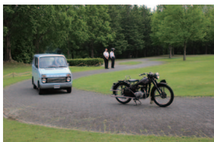
ホンダコレクションホール所蔵車のデモンストレーション走行をご覧いただいた「WEEKEND RUN」(ホンダコレクションホール中庭)。