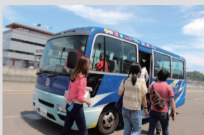
ロードコースサイドに設置されたサービスロードをバスで遊覧、お楽しみいただきました。