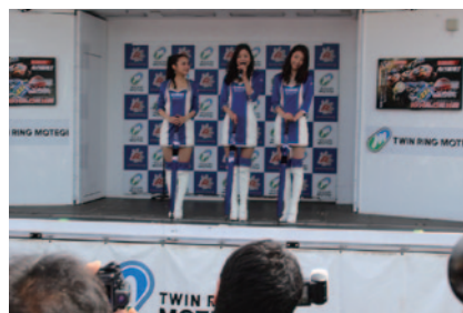
レースに華を添えるキャンペーンガールが一堂に会した「キャンギャルオンステージ」(29日 グランドスタンドプラザオフィシャルステージ)。