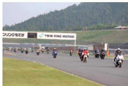
公式予選終了直後のレーシングコースをご自身の愛車でパレード走行いただいた「全日本ロードレース バイクパレード」(28日)。参加資格:「グランプリロードR123」メンバーズまたは「Moto Girls Livika」会員で排気量50cc以上のバイクでご来場の方