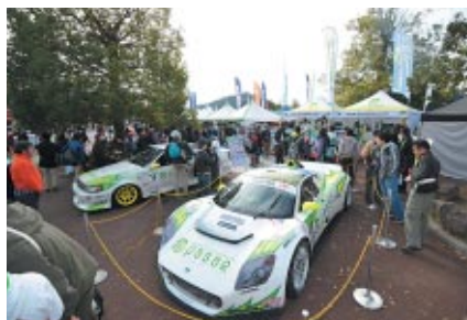
富士スピードウェイで今年から開催されているインタープロトシリーズ参戦マシン「kuruma」が展示されたネクセリア東日本ブース(グランドスタンドプラザ)。