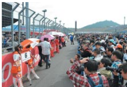
レースクイーン専用のピットウォークをロードコース上でを行い、お楽しみいただきました。