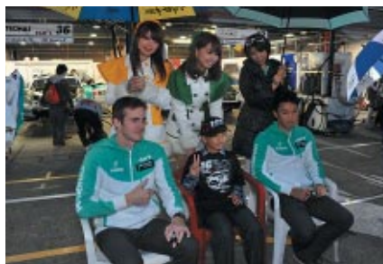
中学生以下のお子さまとご同伴の方に無料でお楽しみいただいた「トランスフォーマー×GT キッズウォーク」。