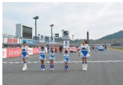
小学1～3年生の女の子が決勝レース前のコース上でツインリンクもてぎエンジェルとともにスタート前ボードを掲出できる「ドリーム☆変身Pit～スタート前ボード体験」。