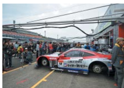
2日(土)朝にピットウォークスタイルで行われた公開車検「オープンピット」。