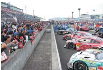
決勝レース後のパークフェルメ(車両保管場所)を間近にご覧いただいた「パークフェルメウォーク」。