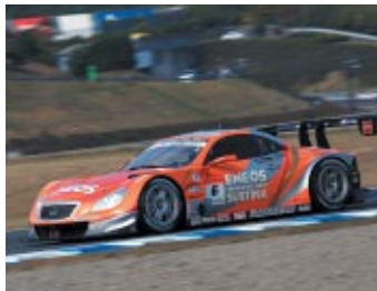
GT500クラス優勝 ENEOS SUSTINA SC430