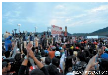
本大会の表彰式に続いてシリーズ表彰式、そして全ドライバーが登場しての華やかな「グランドフィナーレ」で、今季のSUPER GT公式戦が幕を閉じました。