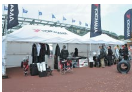
製品展示とグッズ販売が行われたヨコハマブース(グランドスタンドプラザ)。