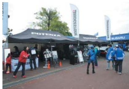
製品展示とグッズ販売が行われた普利ストンブース(グランドスタンドプラザ)。