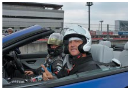
レーシングドライバーの運転するスポーティーカーでロードコースをご体験いただいた「サーキットエクスペリエンス」。