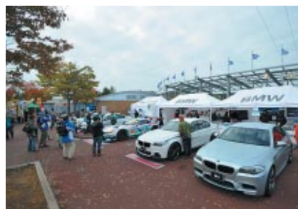
ニューモデルやGT300マシンレプリカが展示されたBMWブース(グランドスタンドプラザ)。