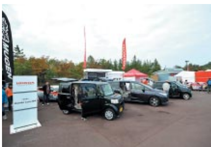
Hondaのニューモデル展示(グランドスタンドプラザ)。