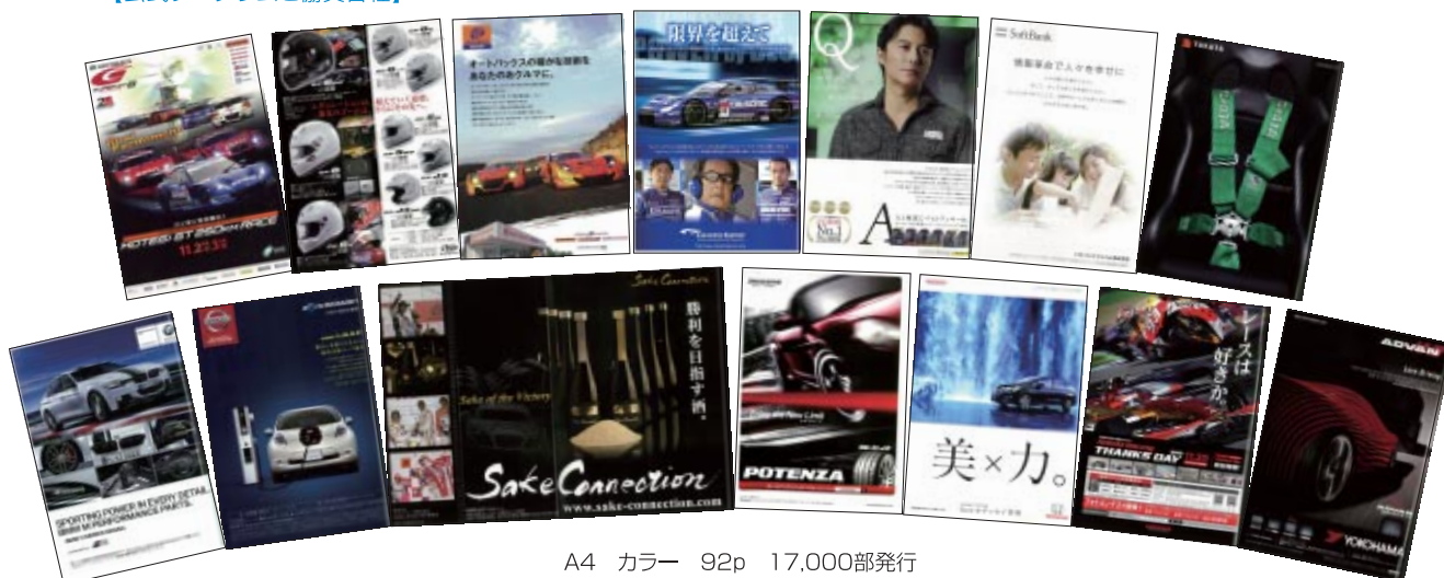
A4 カラー 92p 17,000部発行

株式会社アライヘルメット 株式会社オートバックスセブン カルソニックカンセイ株式会社 株式会社三栄書房 住友ゴム工業株式会社