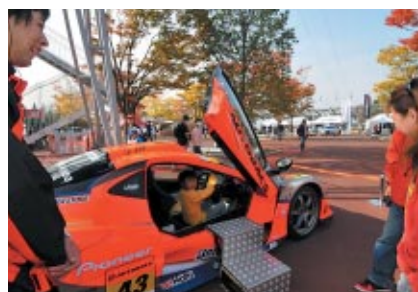
GT300マシン「ガライヤ」の cockpit 体験(キッズ限定)が実施されたオートボックスブース(グランドスタンドプラザ)。