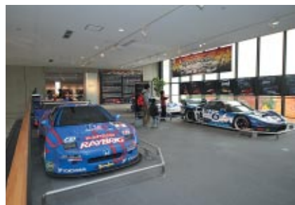
全日本GT選手権とSUPER GTで活躍したHonda NSXの進化の変遷をご紹介する特別展示「『公道～サーキットへ～NSX-GTの変遷～』(Honda Collection Hall)。