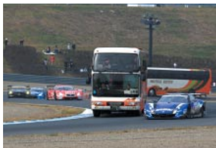
SUPER GTマシンがレーシングスピードで走るロードコースをバスで遊覧走行いただいた「サーキットサファリ」。