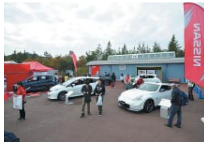
日産のニューモデル展示(グランドスタンドプラザ)。