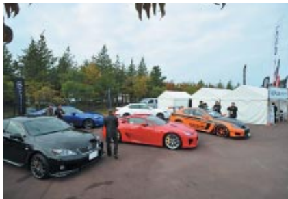
トヨタのレクサスニューモデル展示(グランドスタンドプラザ)。

国内4輪レースの中でも屈指の人気を誇るSUPER GTシリーズ。今年もツインリンクもてぎを舞台にシリーズ最終戦が開催されました。チャンピオン争いの興味はもちろん、GT500クラスは現行マシン最後の一戦とあって、盛り上がりもひとしお。さらに、各パートナー様のプロモーションイベント等が華やかに大会を彩りました。