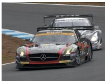
GT300クラス優勝 GAINER DICXEL SLS