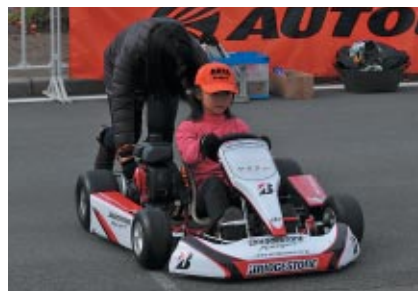
親子でレーシングカートに親しんでいただいた「キッズカート教室」。