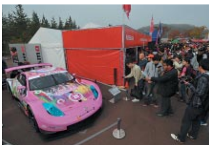
「ももいろクローバーZ」とのコラボによるフェアレディZが展示されたNISMOブース(グランドスタンドプラザ)。