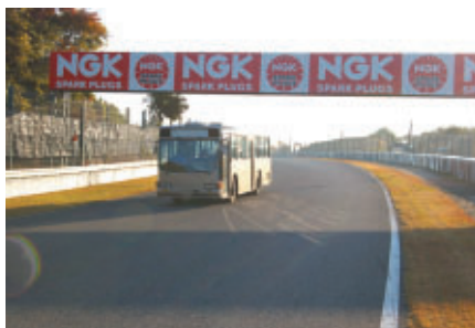
走行開始前に運行された「コース下見バス」 (経験の浅い選手は義務付け)