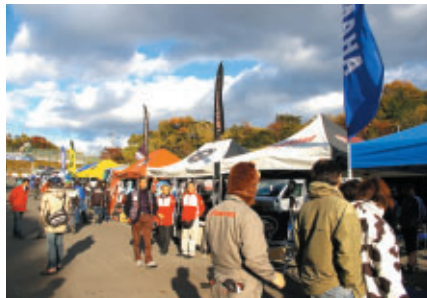
各社のサービスブースでにぎわったパドック