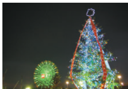
高さ10mのクリスマスツリーと観覧車「ジュピター」の イルミネーションがファンタジックな夕暮れの遊園地を演出しています