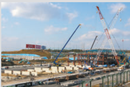
グランドスタンドから(2008年11月29日)

鈴鹿サーキットにご来場いただく全てのお客さまの安全性・快適性・利便性向上のために実施されている改修工事。2009年春の竣工に向けて快調に進められています。