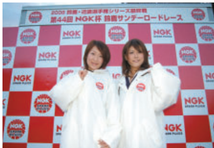
NGKコスチュームをまとった鈴鹿サーキットクィーン