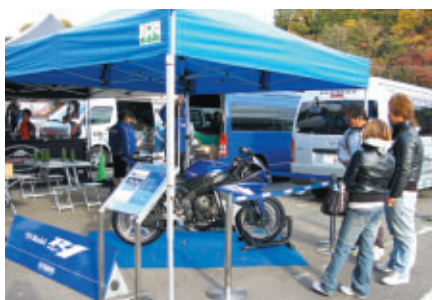
パドックに展示され、注目を集めていた ヤマハYZF-R1 2009モデル