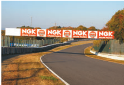
スプーンカーブ手前に設置されたNGKブリッジ

晩秋の鈴鹿を舞台に日本特殊陶業株式会社様のプロモーション活動や参加者サポートをはじめ、様々なイベントが展開されました。