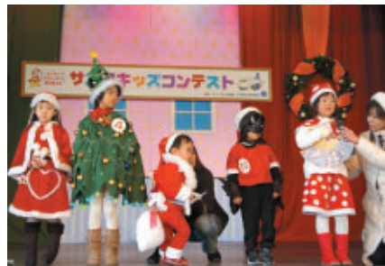
かわいいサンタが大集合! 「サンタキッズコンテスト」 フィンランド往復航空券(ペア)をかけた決勝大会は12月20日に開催されます (協力:フィンランド航空)