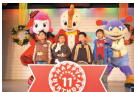
11月生まれのお友だちとコチラファミリーが楽しくすごすイベント 「ハッピーハッピーバースディパーティ」