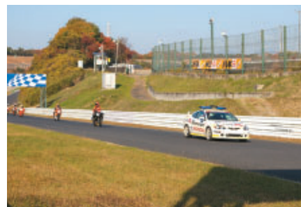
さらにマーシャルカーが先導してのコース体験走行も