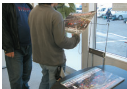
選手受付会場で公式ポスターを無料配布