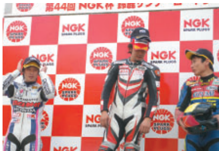
各クラス上位選手にはNGKロゴ入りキャップと副賞を贈呈