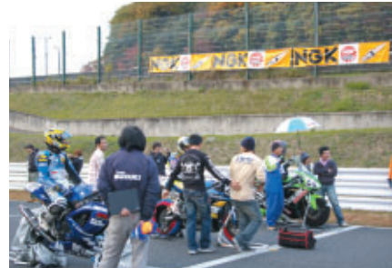
スターティンググリッド横に掲出されたNGK幕