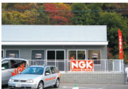
パドック内に設置されたNGK様オフィス