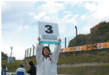
フォーメーションラップ開始3分前を知らせる鈴鹿サーキットクイーン