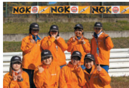
オフィシャルの皆さんもNGKキャップ着用