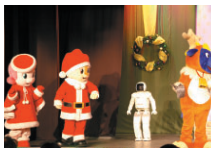
コチラファミリーとASIMOがくりひろげるクリスマスシアター