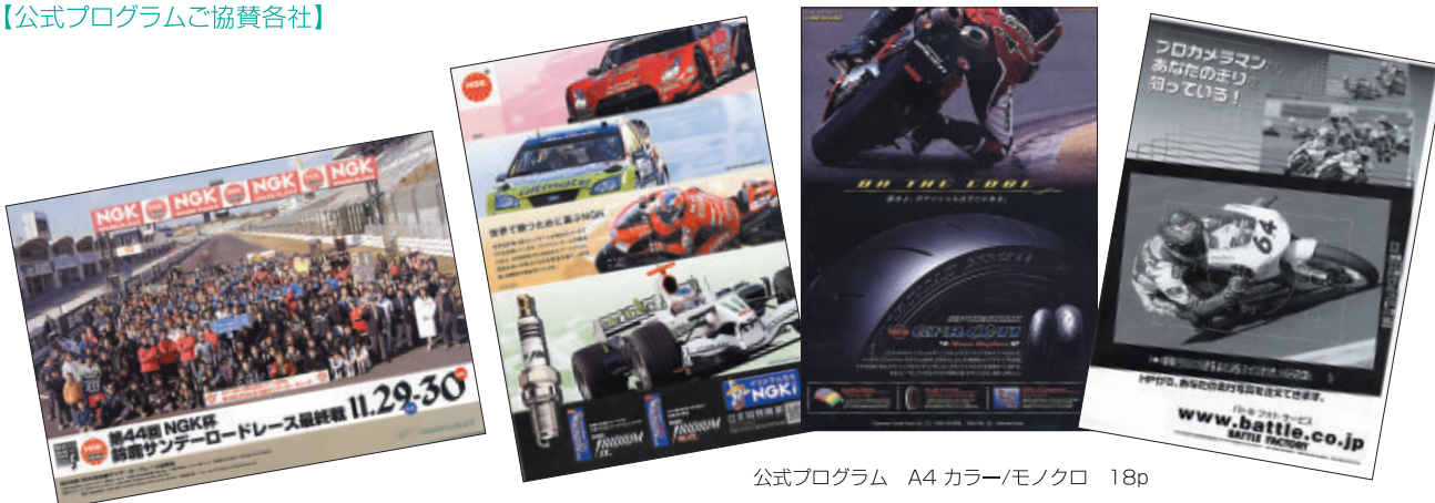
公式プログラム A4 カラー/モノクロ 18p