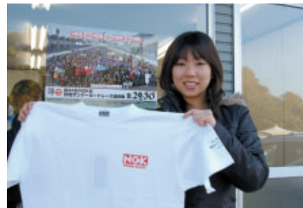
参加者全員に配布されたNGKロゴ入りTシャツ