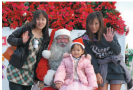
サンタの国、フィンランドからやってきたサンタクロースと記念撮影 (協力:フィンランド航空)

鈴鹿サーキット園内では「コチラのファンファンX'mas」と題した さまざまなクリスマスイベントが展開されています(12月25日まで)