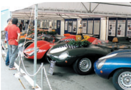
ル・マンの歴史を飾ったマシン群(ル・マンパビリオン)