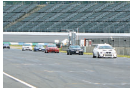
ご自身の車でコースを体験走行 (スポーツカーサーキットチャレンジ)