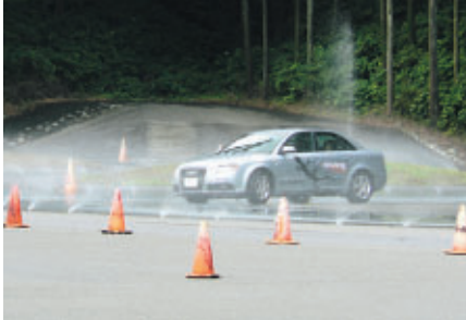
アウディドライビング・エクスペリエンスを場内各所で開催 (アクティブセーフティトレーニングパーク)