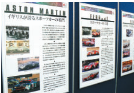
グランドスタンドプラザのPRブースでは ル・マンのすべてをパネル解説