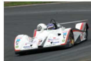
LAV-TEC MYZ GC21