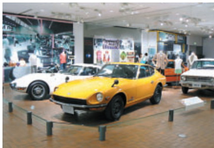
Honda Collection Hallでは、昭和40年代のクルマと文化をテーマとした「クルマが文化になった時代」を開催中