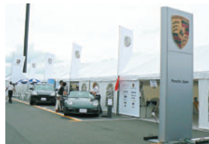
ポルシェのホスピタリティ