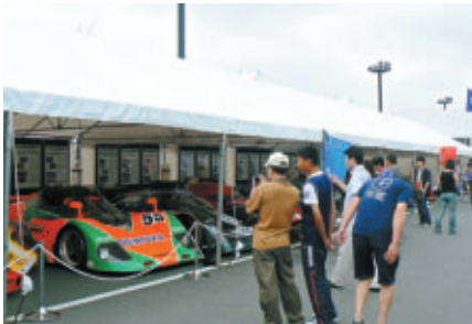
ピットウォーク参加者はパドックの 「ル・マンパビリオン」にも入場OK