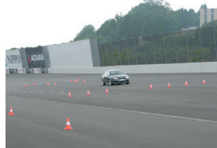
アウディドライビング・エクスペリエンス (スーパースピードウェイ)