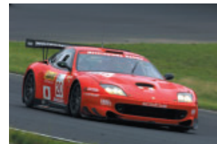
DUNLOP Ferrari 550 GT1