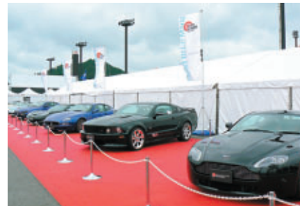
高級スポーツカーを一堂に(スポーツカーディスプレイ)