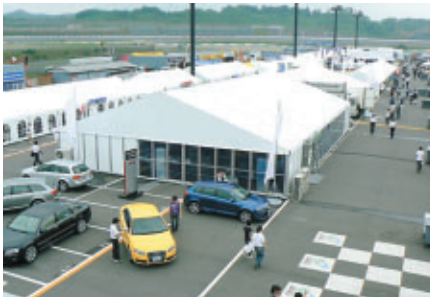
整然とレイアウトされたパドック

伝統のル・マン24時間レースとの連携を打ち出してスタートした全日本スポーツカー耐久選手権。パドックにはホスピタリティブースが設置され、歴代の貴重なマシンやスポーツカーが展示されるなど、華やかな中にも重厚な雰囲気をかもし出していました。