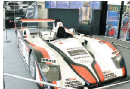
1997年日本チームとして初のル・マン総合優勝を飾ったアウディR8を展示(アウディ R8 パビリオン)