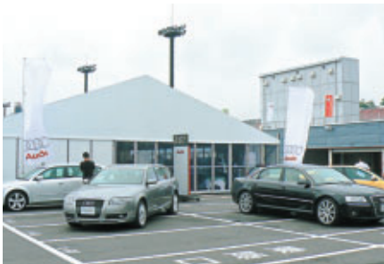
アウディ最新モデルを展示