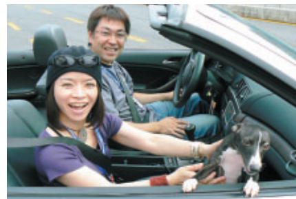
愛犬といっしょにパレードへスタート!