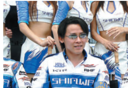
歌手の河村隆一さんが監督に 見事クラス優勝達成!!