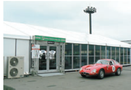
ご招待客をおもてなしするJLMCスイート