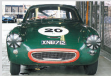
オースチン・ヒーレー・セブリング