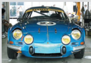
ルノー・アルビオンA110