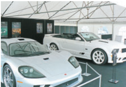
世界のGTRレースで活躍するS7Rのロードゴーイングバージョン