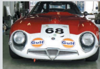
アルファロメオ・ジュリアTZ2