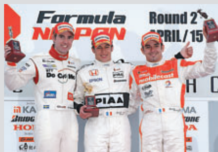
表彰台は外国人勢が独占