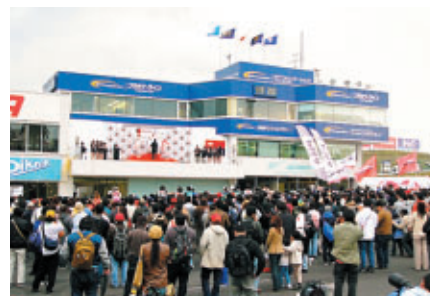
フォーミュラ・ニッポン表彰式時にコース開放