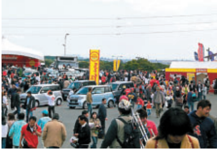
グランプリスクエア