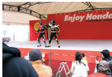
Enjoy Hondaステージには仮面ライダーも登場