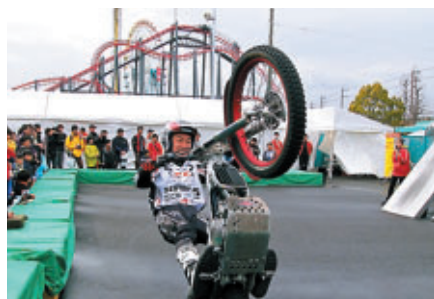
トライアルの華麗なパフォーマンスを間近で