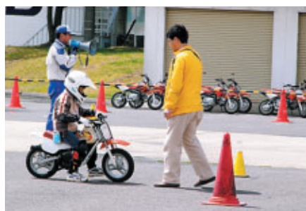
親子バイク教室 交通教育センターにて