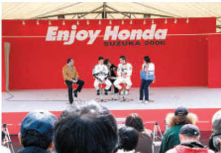
ドライバートークショー