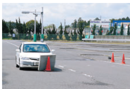
追突軽減ブレーキの体験 交通教育センターにて