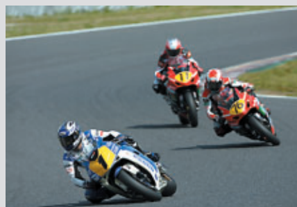
トップグループの激しい争い