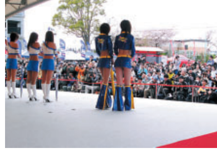
キャンペーンガールオンステージ