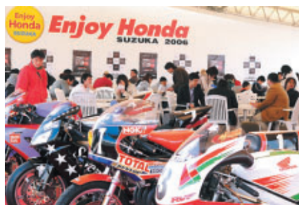
歴代のホンダレーシングマシンを一堂に展示