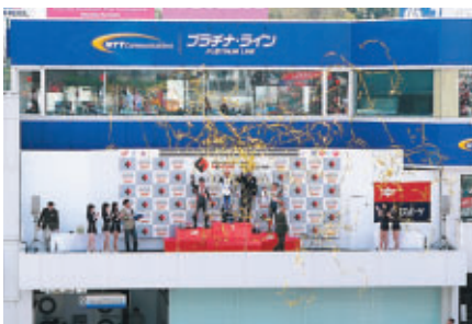
スーパーバイクとフォーミュラ・ニッポン表彰式には特殊効果を使用