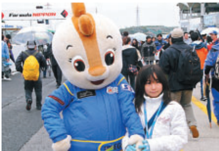
コチラちゃんがピットウォークに登場