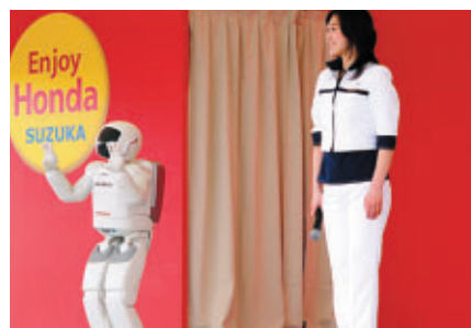
新型ASIMOデモンストレーション