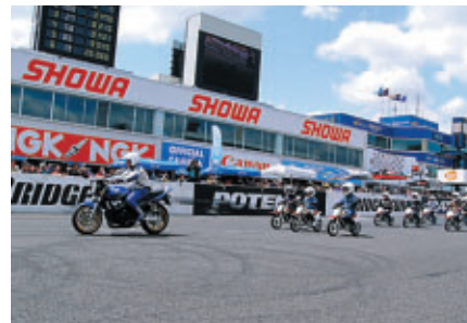
MFJキッズバイクパレード