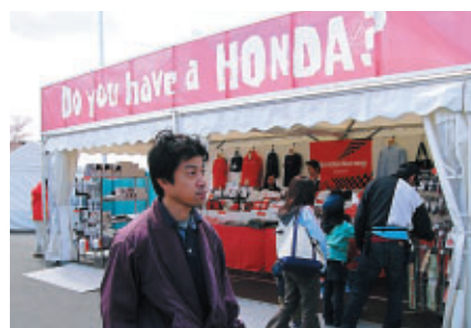
Do you have a HONDA?