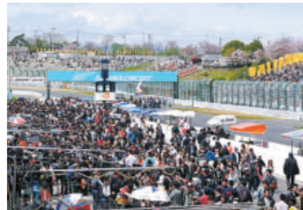
にぎわうピットウォーク