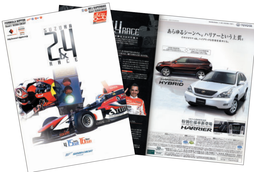
A4 カラー76p 13,000部発行