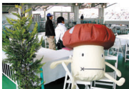
ホスピタリティブースの案内役?