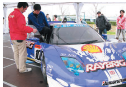
ホンモノのマシンのコクピットを体験