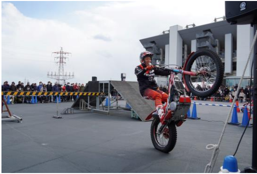
トライアル&モトクロスバイクパフォーマンス