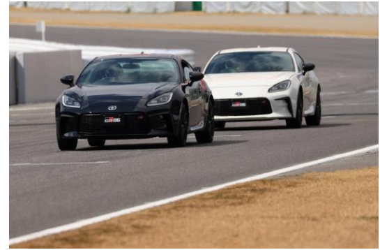
永遠のライバル対決