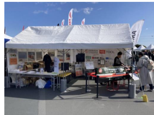
スーパーミニマムチャレンジレーシング