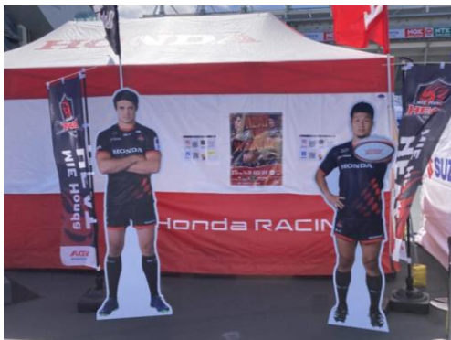
三重ホンダヒート