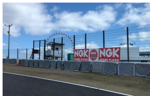
コース看板ご掲出（NIPPOコーナー付近）