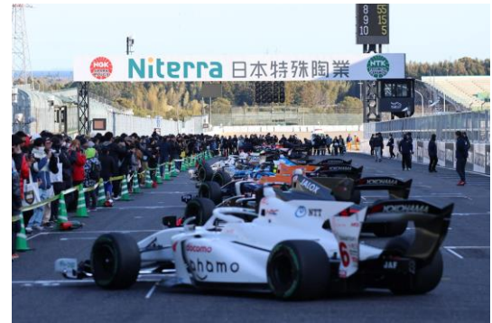
パルクフェルメウォーク