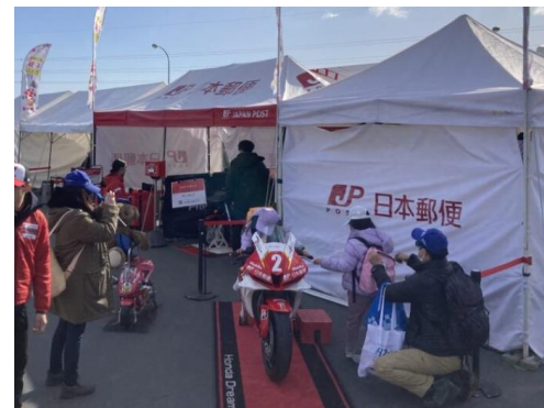
日本郵便（親子バイク教室）