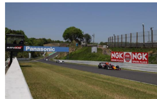
西ストレートネーミングライツ