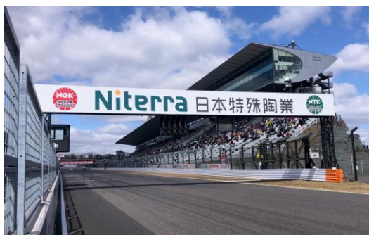
ブリッジ看板（1コーナー側）