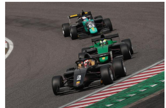
Formula Regional Japanese Championship