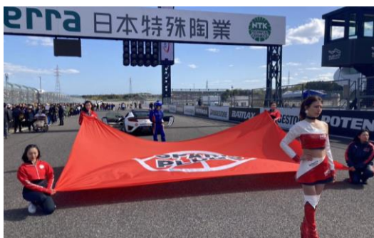
フラッグセレモニー