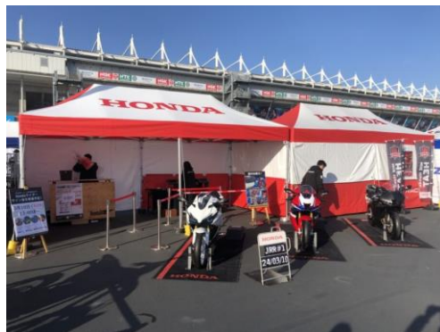
ホンダモーターサイクルジャパン