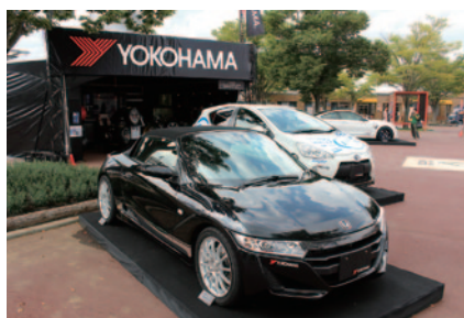
YOKOHAMA製品装着者が展示されたYOKOHAMA ブース(グランドスタンドプラザ)。