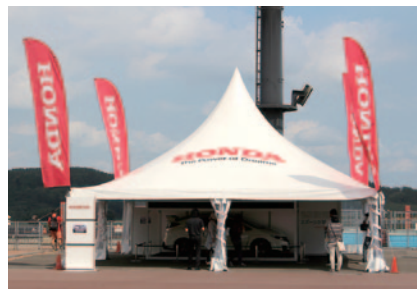
Honda PRブース(グランドスタンドプラザ)。