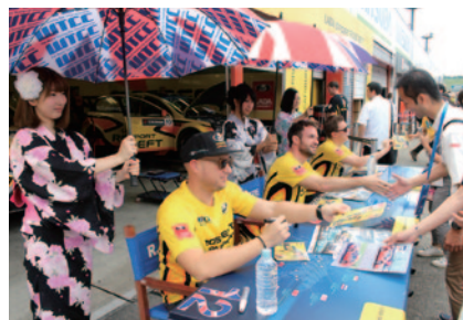
13日(日)ピットウォーク時に行われた全ドライバーサイン会。