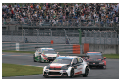
RACE1ウイナー ホセ-マリア・ロペス (シトロエン C エリーゼ WTCC)