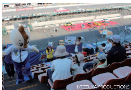
チケットがなくても公式予選を観戦できる「コチラファン クラブ限定スペシャル観戦シート」にはコチラもやってきて、 わかりやすいレース解説が行われました(12日(土))。