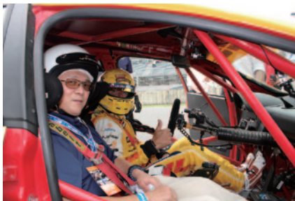
DHLのデモカーはコロンネル選手がドライブ。ゲストと笑顔で。