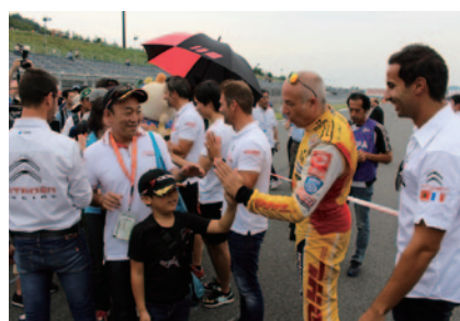
13日(日)には全ドライバーハイタッチ会を実施。