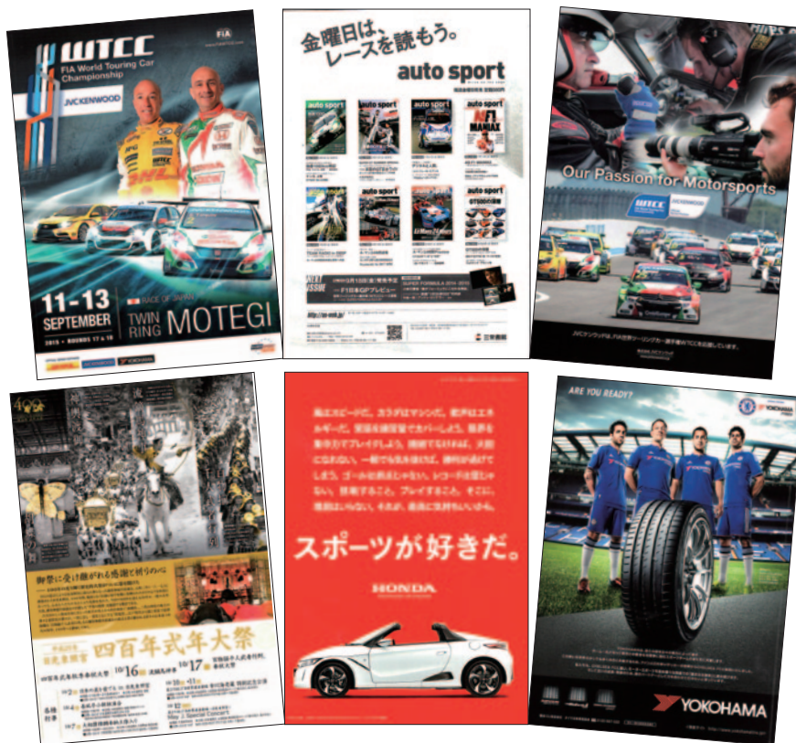
A4 カラー 68p 12,000部発行