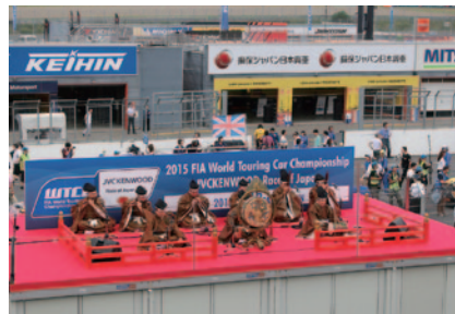
決勝スタート前に行われたオープニングセレモニーには、世界文化遺産「日光東照宮」の楽師たちが登場。厳かな雅楽の調べを奏でました。