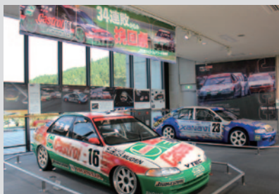
約20年前の国内ツーリングカーレースでのHondaの苦戦と挽回をテーマとした特別展示「34連敗からの挽回劇」。

Honda Collection Hallでは、ツーリングカーを中心とした展示やイベントが行われました。