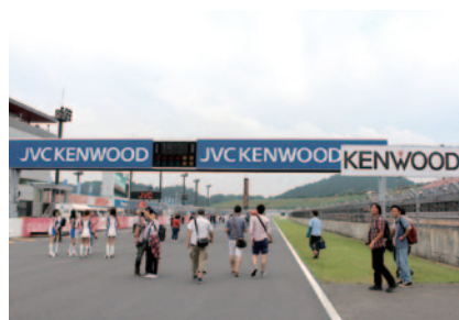
決勝レース終了後にはロードコースを開放。熱いレースの 余韻をお楽しみいただきました。