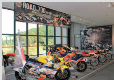
10月11日（日）に決勝を迎える「MotoGP™日本グランプリ」にちなんでHondaの世界GP700勝までの道のりを展示した「ROAD to 700 VICTORY」。