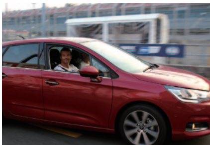
チームやメーカーのゲストを対象とした「プロモーションラップ」。ローブ選手が笑顔でシトロエンC4をドライブ。