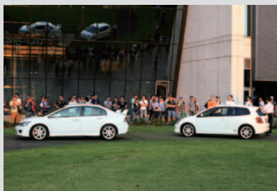
WTCCの開催を記念した「歴代シビックタイプR」スペシャルデモ走行。