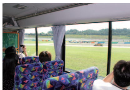
コースに沿う形で設置されているサービスロードから レースを間近にご見学いただいた「サービスロードツアー」。