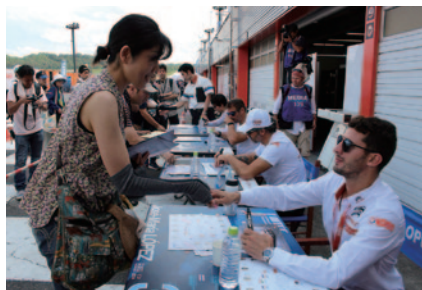
12日(土)にパドックで行われた全ドライバーサイン会。

世界最高峰のツーリングカーレース、WTCC。激しいバトルとはうらはらにファンサービスがたっぷりつまった週末となりました。