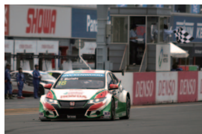
RACE2ウイナー ティアゴ・モンテイロ (Honda シビック WTCC)