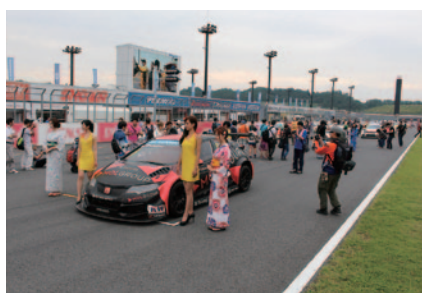
RACE1に先駆けて全マシンをグリッドに展示。