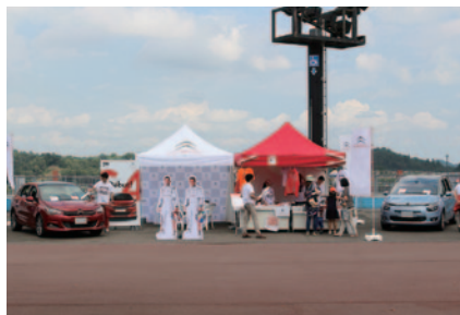
最新モデルが展示されたシトロエンブース (グランドスタンドプラザ)。