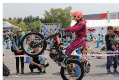
女性ライダーや藤波選手の甥たちが出演してトライアルテクニックを披露したトライアルデモンストレーション(ハローウッズ他)。

PICK UP 1 Honda Collection Hallでは、世界選手権参戦開始20周年を迎える藤波貴久選手の足跡をたどる特別展示や、競技生活をふりかえるトークショーが行われました。