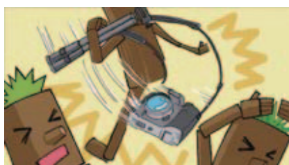
■カメラのレンズを振り回さない!