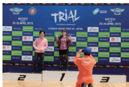
メガジップライン つばさをご利用いただいた方の中から抽選でポードイラム(表彰台)での記念撮影をお楽しみいただきました。