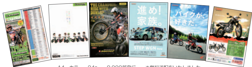
A4 カラー 24p 9,000部発行 ※無料で配布いたしました