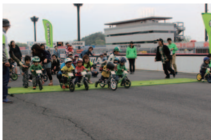
100mの直線コースでいちばん速いのは誰かを決めるスペシャル競技「100m直線番長」(スーパースピードウェイ)。