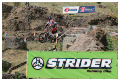
各セクションに設置されたストライダーバナー。