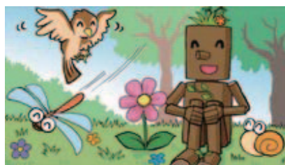
■森の生物を大切に!