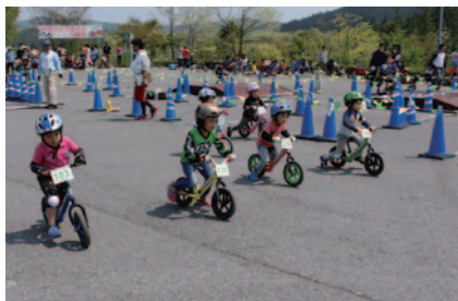
ストライダー公認レース「ストライダーエンジョイカップ」。頂点をめざして800台以上のエントリーを集め、熱い戦いが繰り広げられました(ハローウッズ)。

2歳から乗れるランニングバイク、ストライダー。今大会はストライダージャパン様に冠スポンサーとしてご協賛いただき「ストライダー日本グランプリ」と銘打って、さまざまなイベントを展開。華やかに本大会を盛り上げていただきました。