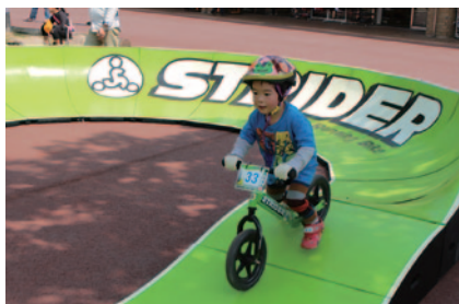
BMXやMTB発祥の、アップダウンを持つU字型コース、バンクトラック。ストライダー専用トラックが日本初上陸、タイムアタックも行われました(グラッドスタンドプラザ)。