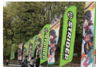
ストライダージャパン