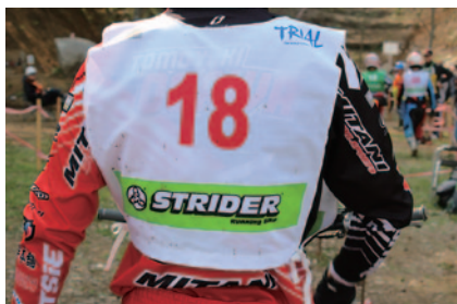
選手、競技役員らのピブスにもストライダーロゴが。