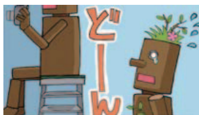
■脚立の使用は、後ろを気にして!