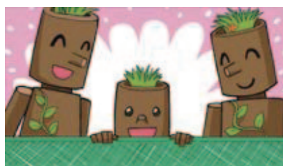
■子どもにやさしく!