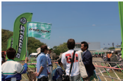
トライアル観戦初心者を対象にセクションやピット・パドックなどを解説付きでご案内した「初心者向け! トライアル観戦ツアー」。