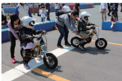
親子でバイクの乗り方と楽しさを体験いただいた「親子バイク体験会」。今回はBetamotor japan様のご協賛により電動バイク(写真)を用いての体験も行われました(中央エントランス)。