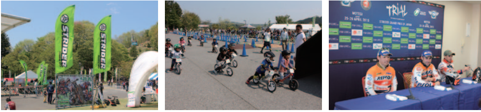
ストライダージャパン