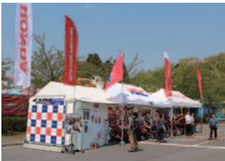
株式会社ホンダ・レーシング 本田技研工業株式会社