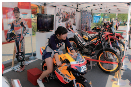
トライアル、MotoGP™、モトクロスなど、オフ&オンのレーシングマシンの展示・搭乗体験が行われたHRCブース(中央エントランス)。