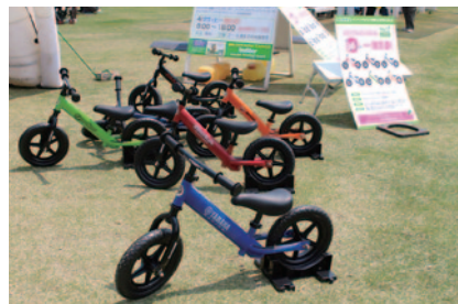
トライアルとのコラボレーションで生まれた限定モデルを、大会期間中にツインリンクもてぎにご来場いただいた方の中から36名様に抽選でプレゼントいただきました(中央エントランス)。