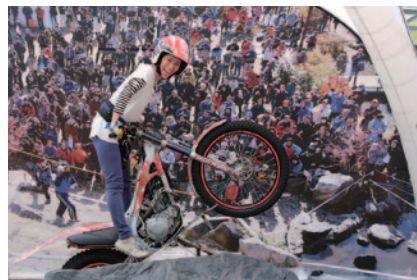
トップライダー気分が味わえるフォトコーナー「なりきりトライアルライダー」(グラウンドスタンドプラザ)。(本田技研工業株式会社)