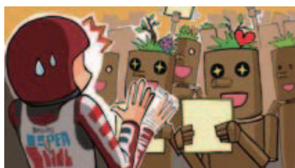
■サインを無理矢理ねだらない!