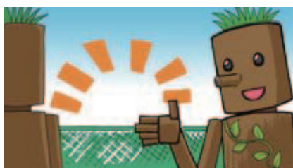
■ゆずり合って観戦しよう!