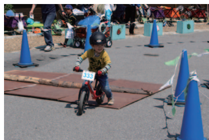
ストライダー未経験のお子さまも安心してストライダーにチャレンジできる体験コース「ストライダーアドベンチャーゾーン」(ハローウッズ)。