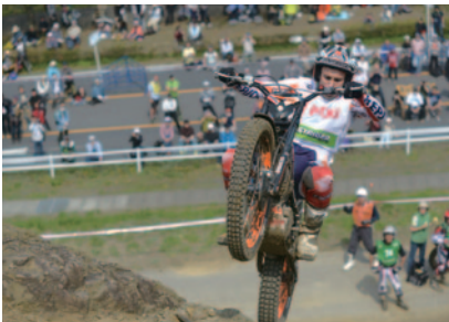
「ストライダー日本GP」完全制覇を果たしたボウ