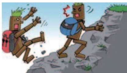
■ケガをしないように気をつけよう!

マナーを守って気持ちよく!ご来場いただいたすべてのお客さまに自然の中のトライアルを楽しんでいただけるよう「トライアルマナーアップキャンペーン」を実施、公式プログラムやサーキットビジョンでの紹介や場内実況での呼びかけを行いました。