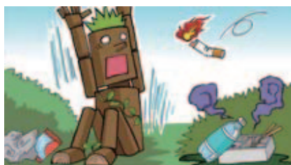
■たばこやゴミのポイ捨てをしない!