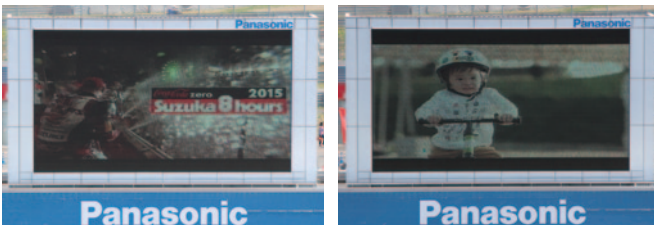
コカ・コーラ ゼロ