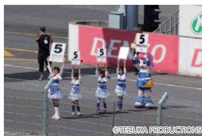
JSB1000クラス決勝スタート前のカウントダウンボードをツインリンクもてぎエンジェルと一緒に掲出いただいた「なりきりエンジェルスベシャル!!」(31日)。