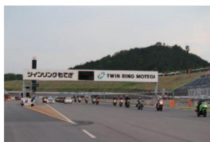
予選終了後の興奮さめやらぬレーシングコースを自分のバイクで走行いただいた「グランプリR123メンバーズパレード」(30日)。