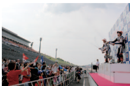
中学生以下のお子さまとそのファミリー限定で、ステージ間近で表彰式をご覧いただいた「表彰式ファミリーエリア」(31日)。