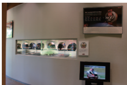
Hondaのグランプリ優勝700勝目を目前に、選手が実際に着用したヘルメットやサイン入りパネルが展示された「カウントダウン700勝ラウンジ」(Honda Collection Hall)。