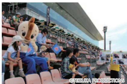
レースをわかりやすく解説!「コチラファンクラブ限定!スペシャル観戦シート」(30日 グランドスタンドA席)。