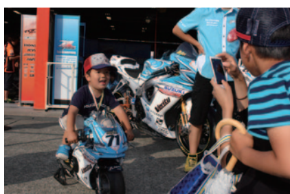
中学生以下のお子さまとその保護者に無料でお楽しみいただいた「コチラレーシングのキッズピットワーク」(30日)。