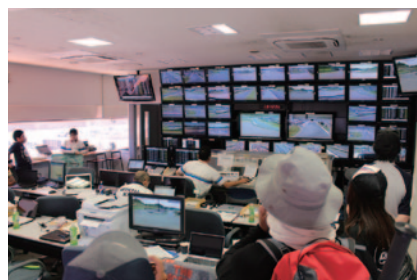
ふだん入ることのできない管制室のモニター見学などレースの舞台裏を味わっていただいた「サーキット・ツアーズ」。