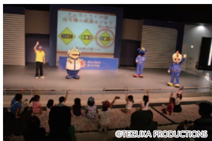
コチラレーシングと一緒にクイズやダンスで楽しく交通安全を学んでいただいた「コチラの交通安全教室」(ファンファンラボ)。