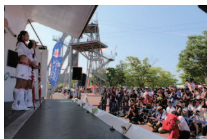
グラウンドスタンドプラザオフィシャルステージで行われた 「キャンギャルオンステージ」。