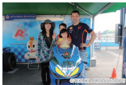
2輪・4輪のレーシングマシン搭乗体験が行われたコチラレーシングブース(グランドスタンドプラザ)。