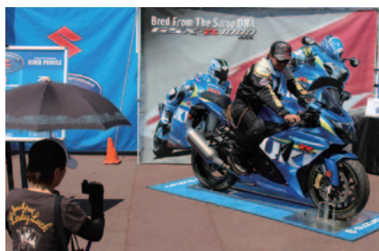
ニューモデルの搭乗体験が行われたSUZUKIブース (グラウンドスタンドプラザ)。