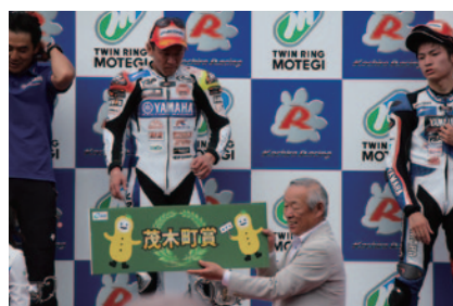
各クラス決勝レース上位3選手には茂木町特産品が特別賞として贈られました(31日)。