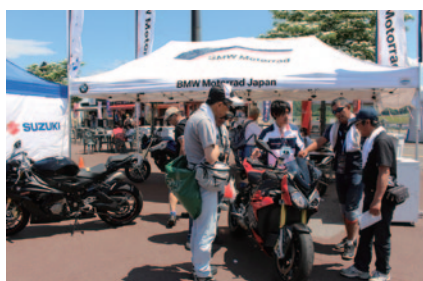
ニューモデルの展示が行われたBMW Motorradブース (グラウンドスタンドプラザ)。