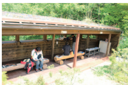
ハローウッズ内に設けられた「ライダーお休み処」。バイクでご来場の方にはミニボトルナチュラルウォーターがプレゼントされました。