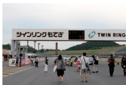
決勝レース終了後のコースを歩いてご体験いただいた「家族みんなでコースウォーク」(31日)。