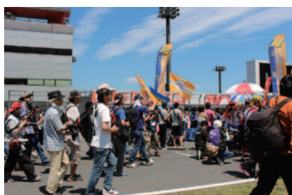
スタート前の緊張感あふれるグリッドにお子さまとその保護者100組をご招待した「コチラレーシングのキッズグリッドワーク」(31日)。