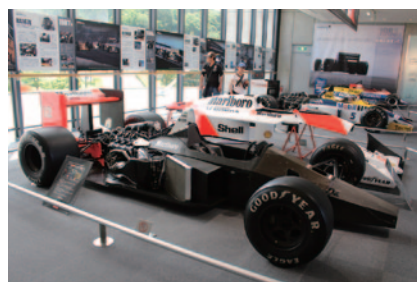
1980年代にHondaがF1世界選手権に挑戦したターボマシンの特別展示「POWERED by HONDA 1000馬力ターボ回顧録【カウルレス展示編】」(Honda Collection Hall)。