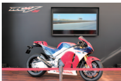
RC213V-Sが展示されたHondaブース。

グランドスタンドプラザを中心に設置された各パートナー様PRブースでは、華やかにプロモーションイベントが展開され、世界最高峰の2輪レースを彩りました。 (順不同・敬称略)