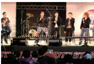
「グランプリロードR123」を終えたばかりの「RGツーリングクラブ」の皆さんによる爆笑のトークステージ。

10日(土)に行われた恒例の前夜祭。MOTO STAGEを中心に、決勝に向けての期待と興奮をはらみながら、トークやライブで熱く盛り上がりました。