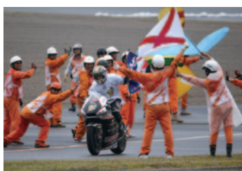
Moto2™クラス チャンピオン獲得に華を添えたヨハン・ザルコ