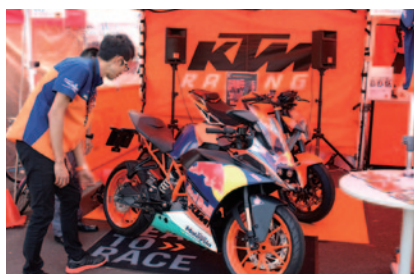
ニューモデルの展示・搭乗体験が行われたKTMブース。