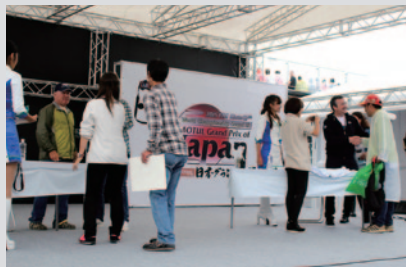
トークショーと同時進行で行われたサイン会。たくさんファンと触れ合いました。