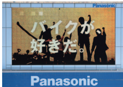
株式会社ホンダモーターサイクルジャパン