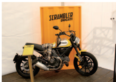
ドゥカティジャパン株式会社