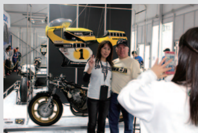
特別企画展「RASHIN(裸身)」会場では、ファンの皆さんとのツーショット撮影にこたえるプレミアムなイベントが実施されました。