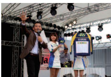
トップライダーたちのサイン入りグッズが多数出品された「MotoGP™ライダーチャリティーオークション」。収益金は日本赤十字社を通じて東日本大震災被災者への義援金として役立てられます。