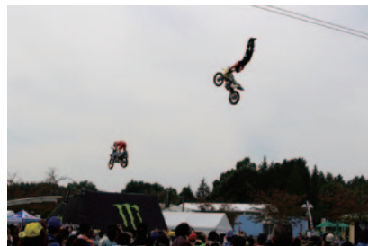
世界を舞台に活躍する日本人トップライダーたちのスーパーパフォーマンス! フリースタイルモトクロス (FMX) デモンストレーション。