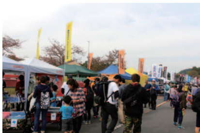
カスタムバイク関連メーカー、ショップ等が一堂に会した「カスタムビルド」。スペシャルマシンやパーツなどバイクライフを楽しくするアイテムでいっぱいでした。

中央エントランス付近に設けられた「グランプリオアシス」。バイクにちなんだイベントやブースを集中展開。バイクファンはもとより、親子やバイク初心者の方にもお楽しみいただける構成でレース観戦の合間を楽しくお過ごしいただきました。