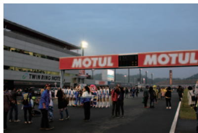
全スケジュール終了後、レースの余韻が残るロードコースをご自身の足で体感いただいた「プレミアムコースウォーク」(11日)。