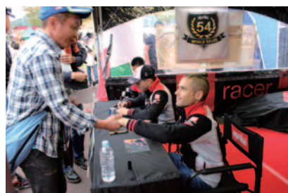
ステファン・ブラドル、アルバロ・パウディスタ各選手(奥から)のサイン会が行われたApriliaブース。