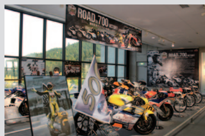
GP通算700勝を達成したHondaのGPレーシング歴史を紹介した「Road to 700 Victory ~勝利を支えたマシンたち~」。