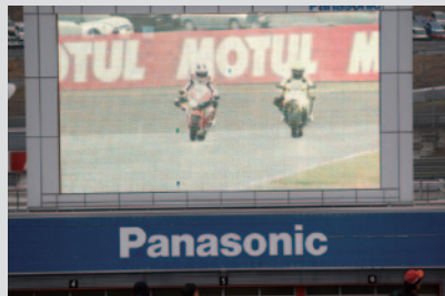
MotoGP™決勝終了後に行われたスペシャルデモラン。スペンサー氏が「Honda RCV213V-S」を、ロバーツ氏が「YAMAHA YZF-R1 60th Anniversary」をライディングしました。