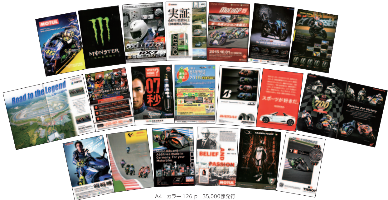
A4 カラー 126 p 35,000部発行