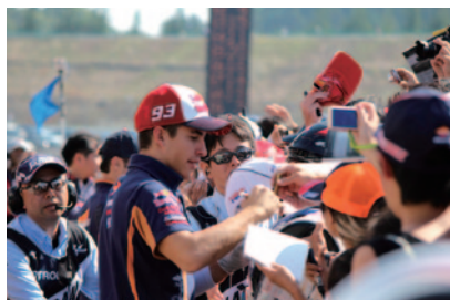
10日(土)の「キッズピットウォーク」では各選手が登場し、サイン会を行いました。