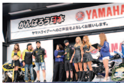
“コカ・コーラ ゼロ”鈴鹿8耐を制した中須賀克行、ボル・エスパルガロ、ブラッドリー・スミス各選手(左から)が一堂に会したYAMAHAブース。