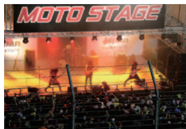
世界的に有名なギタリスト、マーティ・フリードマン氏のスペシャルライブでデモンションは最高潮に。