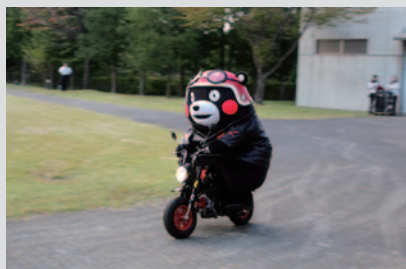
「くまモンキー」をデモラン(Honda Collection Hall)。

バイクの街 熊本から、熊本県営業部長の“くまモン”がHondaの応援とPRに来場しました。