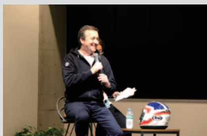
1985年の偉業を振り返る「フレディ・スペンサー氏 ダブルタイトル獲得30周年記念トークショー」。

PICK UP 3 Honda Collection Hallでも、WGP/MotoGPにちなんだスペシャルイベントが開催されました。