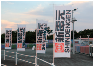
新電元工業株式会社