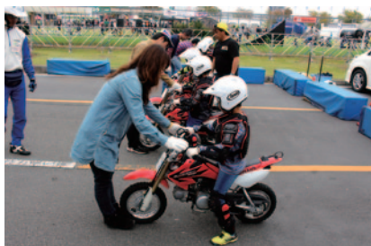
ツインリングもてぎのアクティブトレーニングパークのプログラム「親子でバイクを楽しむ会」をベースに楽しみながら学んでいた「親子バイク体験会」。