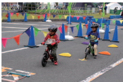
2歳から乗れるランニングバイク「ストライダー」の体験コーナー。