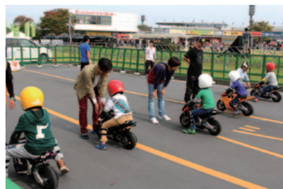
数々のトップライダーを輩出したポケバイの体験走行会。