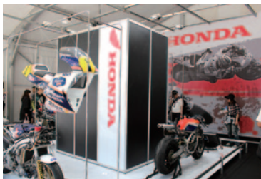
1970年代からのHonda、YAMAHA、SUZUKIのGPマシンがカウルレスで展示された特別企画展「RASHIN(裸身)」。

昨年に引き続き、ロードコースサイドに設けられたV席(ピクトリースタンド)。マシンの走りを間近に体感いただけるロケーションに加えて、スーパースピードウェイには展示・PR・飲食ブースなどからなる「ホスピタリティガーデン」が設置され、イベントステージ「MOTO STAGE」も併設。レースのみならず快適な観戦環境をご提供させていただきました。