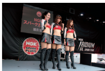
NGKスパークガールズの撮影会が行われたNGKブース。