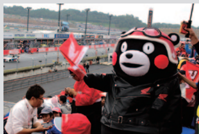
HondaファンシートでHondaライダーの応援!