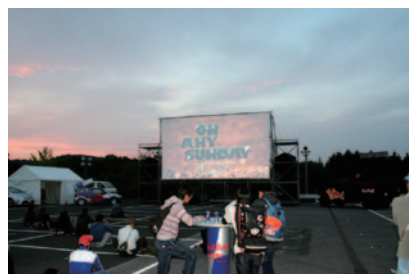
1971年に公開された映画「栄光のライダー」の現代版「On Any Sunday - The Next Chapter -」の上映会がS2駐車場で行われました(10、11日)。

PICK UP 3 Honda Collection Hallでも、WGP/MotoGPにちなんだスペシャルイベントが開催されました。