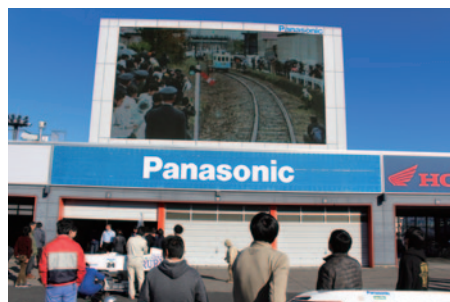
廃線を乾電池で復活させたパナソニック様のCMがオンエアされる大型ビジョンに見入る参加者の皆さん。