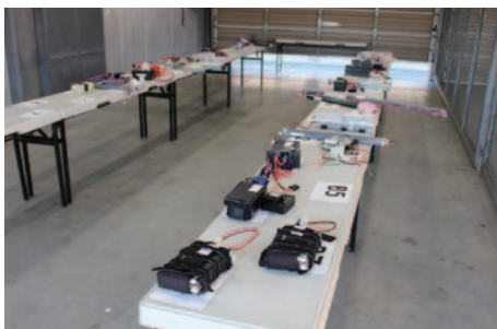
各車両に搭載される単三形乾電池「パナソニック エボルタ HHR-3MWSJ」。公式車検後の走行前と競技のインターバルには専用ピット内に預けられ、オフィシャルによって保管されます。