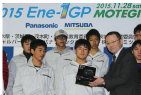
KV-BIKE クラスII総合優勝の飯田OIDE長姫高校課題研究A組の皆さん。