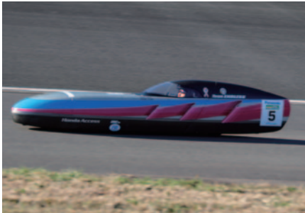
驚異のコースレコードを記録したTeam ENDLESS。

「ONE LAPタイムアタック」では好タイムが連続。ついに3分の壁が破られました。2年連続でトップタイムを叩き出したのはKV-1クラスのTeam ENDLESS。2分37秒261は自身が持つ従来の3分01秒233のコースレコードを大幅に更新。総合3連覇を狙うTeam BIZONが2分49秒347で続けました。KV-2クラスはteam Motosが4分07秒853でトップタイムを記録しました。