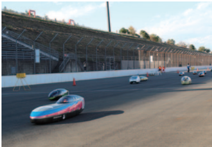
「e-kiden 90分ロングディスタンス」スタートシーン

KV-1クラスは7番手スタートのZDPが29周を記録して優勝。2位に入ったTeam BIZONと同ポイントながら、この競技が優先されるため、総合初優勝を果たしました。KV-2クラスは飯田OIDE長姫高校が逆転で3連覇を果たしました。