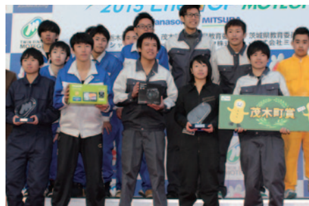
KV-40クラス2総合優勝の飯田OIDE長姫高校の皆さん。みごとな3連覇です。