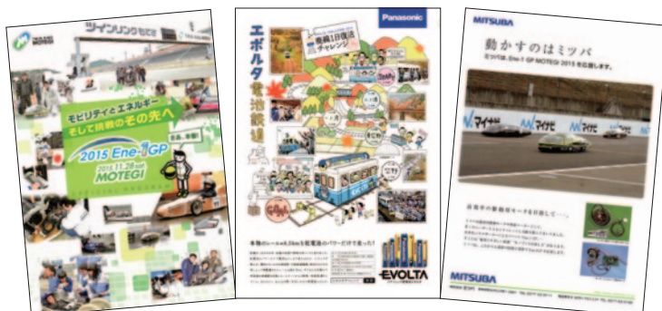
A4 カラー 12p