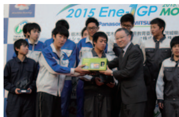
パナソニック株式会社

KV-40 クラス1(総合) KV-2 クラス2(総合) KV-BIKE クラスI(総合) KV-BIKE クラスII(総合)