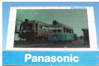
パナソニック株式会社