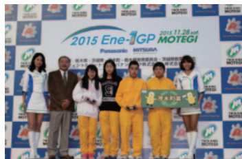
パナソニック株式会社 株式会社ミツバ