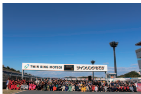
お昼のインターバルに行われた参加者の集合写真。真剣な競技の合間の楽しいひと時です。