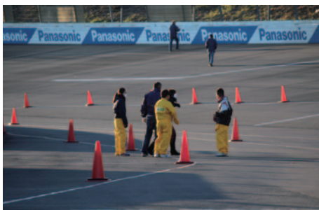
大会当日の朝に競技会場のスーパースピードウェイを開放、自分の足で路面チェックを行っていただきました。