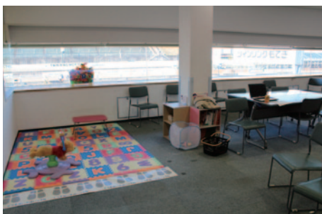
コントロールタワー 2階に設けられた休憩室。