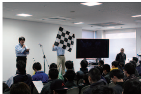
開会式に続いて開催されたフリーフィングでは、安全かつ円滑な競技運営を実現すべくオフィシャルによるシグナルフラッグ説明などが行われました。