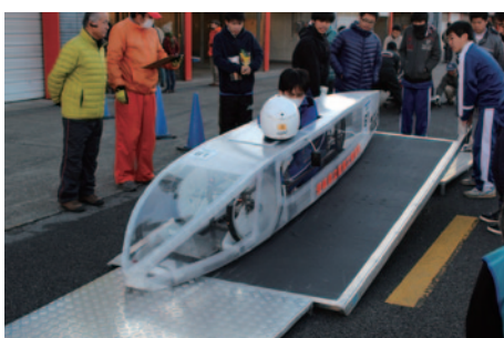
車両重量やドライバー装備、ブレーキ性能チェック(写真)など安全面に重点が置かれた公式車検。