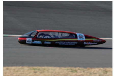
KV-2クラス3連覇を果たした飯田OIDE長姫高校。