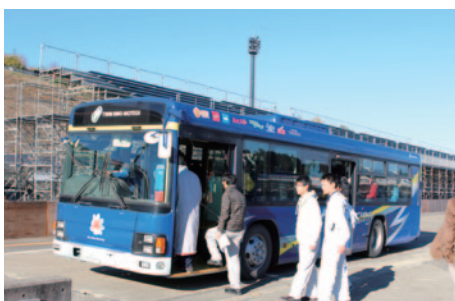
競技開始直前にはバスでコースの下見を行っていただきました。