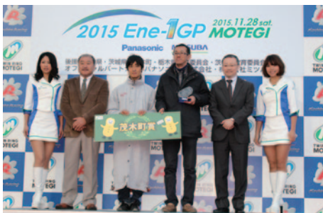
KV-40クラス1総合優勝のZDPの皆さん。初の栄冠です。