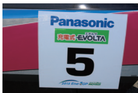
パナソニック様のロゴ入りゼッケンが全参加車両に貼付されました。