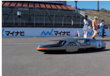
「e-kiden 90分ロングディスタンス」を制し、総合優勝のZDP。