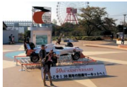
ゆうえんちウェルカム広場に設置された鈴鹿サーキット50周年モニュメントとフォーミュラカーフォトコーナーとして大人気でした