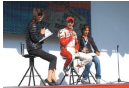
注目のHondaシビックを駆るティアゴ・モンテイロ選手のトークショー