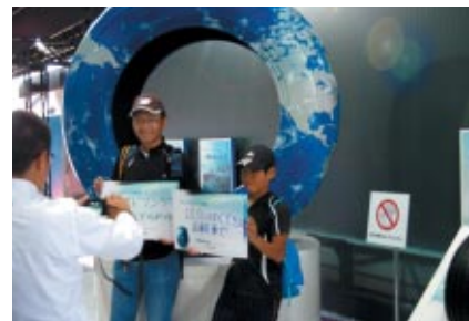
「私のECO活動」を書いていただいたお客さまにはトートバッグをプレゼント、さらにステージのビジョンでご紹介しました

PICK UP 1 10月20日(土)夜、ビットビル2Fホスピタリティラウンジで横浜ゴム様主催のウェルカムパーティが開催されました。