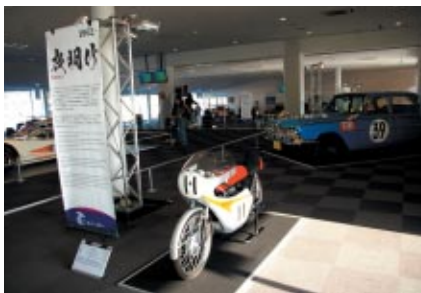
鈴鹿サーキット50年の歴史を彩った2輪・4輪の名車がピットビル2Fホスピタリティラウンジに一堂に会した「鈴鹿サーキット タイムマシン展示」(11/4<日>まで)