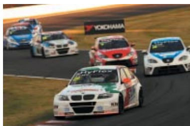
リバースグリッドのRACE2はダステが今季2勝目