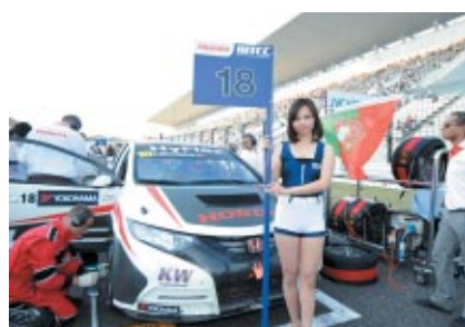
三重県内の美少女が登場する「三重美少女図鑑」のモデルの 皆さんがグリッドガールとして華を添えました