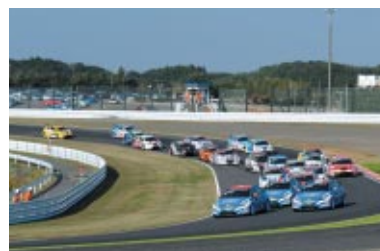
スタート直後の接近戦