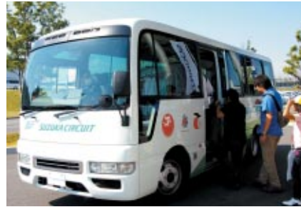
無料シャトルバスで各エリアへのアクセスを気軽にお楽しみいただきました