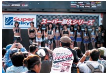
レースクイーンオンステージ(写真)などさまざまなイベントが展開された「スーパー耐久オフィシャルステージ」