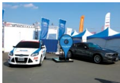
WTCCマシンとニューモデルが展示されたフォードブース