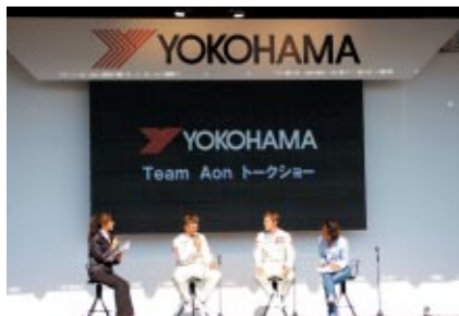
Team Aon トム・チルトン選手(左)とジェームス・ナッシュ選手のトークショー