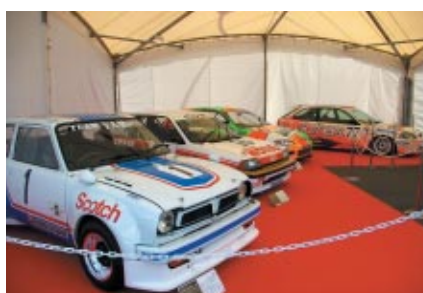
今回WTCCにデビューしたHonda シビックは誕生40周年それを記念して歴代のレーシングシビックがHondaブースに展示されました