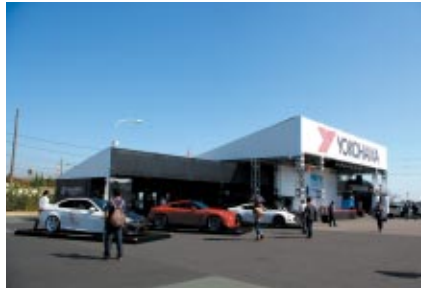
GPスクエアに設置されたYOKOHAMAブース

WTCCとスーパー耐久のワンメイクタイヤサプライヤーであるヨコハマタイヤ様には、GPスクエアでのPRブースを中心としたプロモーション展開を実施いただき、大会を華やかに彩っていただきました。