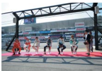
決勝レースを直前に控えてのトークショー、 ドライバーアピランスを開催 左からG.タルクイーニ、T.モンテイロ、J.ナッシュ、T.コロネル、 Y.ミューラー、吉本大樹の各選手