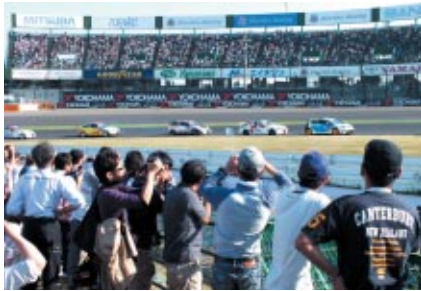
WTCCの醍醐味をより間近で感じていただくべく、おなじみの「激感エリア」を4か所に設置しました(写真は2コーナーイン側)