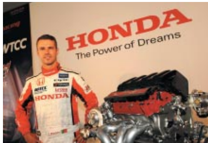
今大会注目を集めたHondaシビックの参戦記者発表会が10月20日(土)に行われました