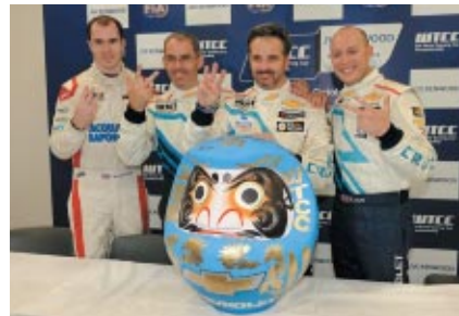
RACE1での完全勝利を祝って青いダルマに目を入れたシボレードライバーたち