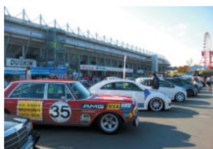
雑誌「eS4」 「GERMAN CARS」 「ル・ボラン」とタイアップ、さまざまなジャンルのヨーロッパ車が一堂に会した「SUZUKA ユーロカーズミーティング」