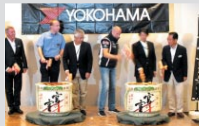
関係者一同による鏡割りと振る舞い酒