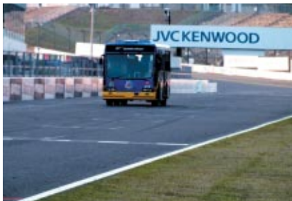
WTCCレース1の優勝者を予想して的中させた方を対象としたバス走行