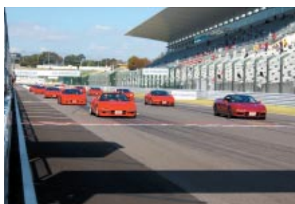
鈴鹿サーキット50年の歴史の中でさまざまな名勝負を演じてきたレーシングマシンのベース車100台以上がパレードした「ツーリングカータイムマシンパレード」