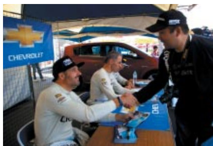
シボレーブースで行われたシボレードライバーサイン会