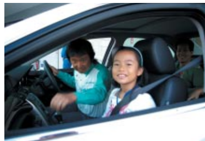
コチラちゃんファンクラブ、コチラレーシングファンクラブ会員の方の中から抽選でお楽しみいただいた「マーシャルカー同乗体験走行」