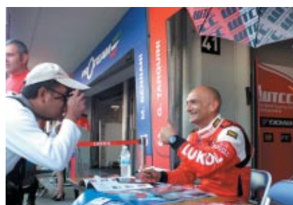
WTCCはファンサービスも充実 決勝日のピットウォークでのサイン会