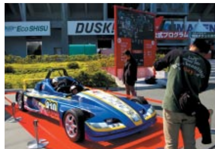
コチラレーシングブースでは「FE810」搭乗体験が人気を集めていました