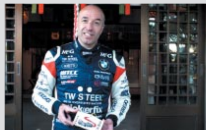
鈴鹿高校書道部&美術部デザインによるオリジナル絵馬に勝利への思いを書きました