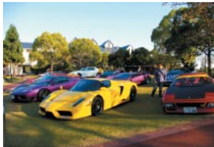
スーパーカーが鈴鹿サーキットホテルエリアに大集合。搭乗体験やエンジンサウンドをお楽しみいただきました