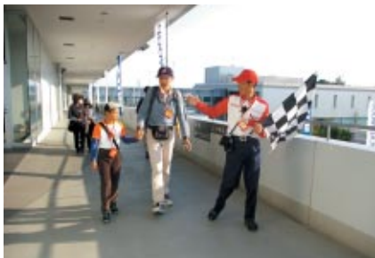
コチラレーシングカートでライセンスを作成し、コチラレーシングファンクラブにご入会いただいた方を対象にレース運営エリアなどご体験いただいた「コチラレーシングファミリー バドックツアー」