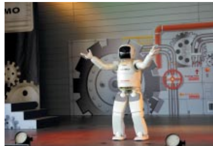
ゆうえんち内モビステージで行われた「ASIMOテクニカルライブ」