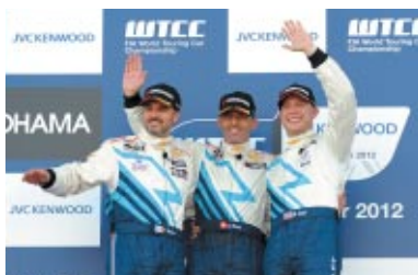
RACE1の表彰台はシボレー勢が独占