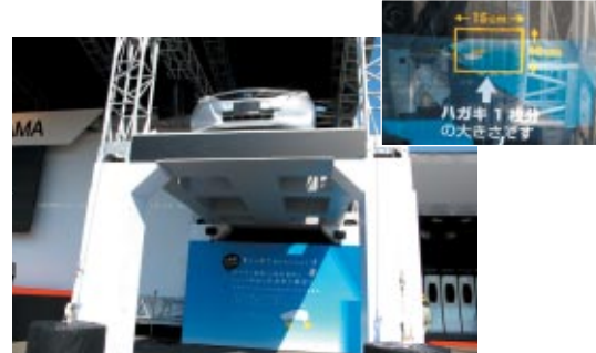
タイヤ1本あたりの設置面積はわずかハガキ1枚分!を実感いただいた展示