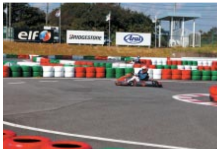
ドリームR、コチラレーシングカート、アドバンスカート(写真)でタイムアタックを開催。上位の皆さんに吉本大樹選手のサイン入りグッズなどをプレゼントしました