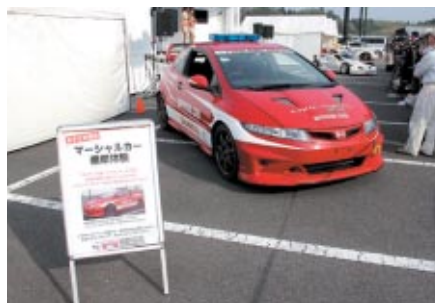
パドックで行われたマーシャルカー搭乗体験