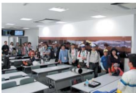
普段は入れないレース運営の中核部などをご覧いただいた「モータースポーツバックヤードツアー」