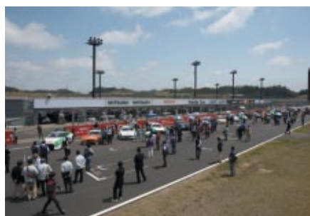
コース上にS耐マシンを展示し、間近にご覧いただいた「スーパー耐久マシン紹介コーナー」