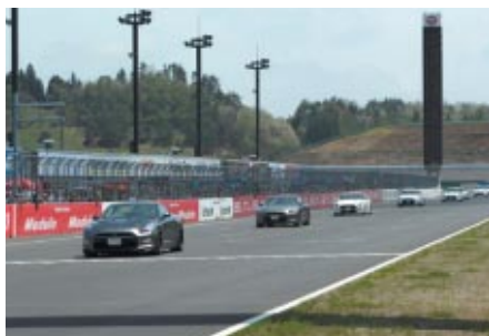
ニッサンGT-R (写真) オーナズクラブの皆さんがロードコースをパレードしました