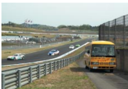
レーシングコースに沿って設置されたサービスロードをバスでご体験いただいた「サービスロードバスツアー」