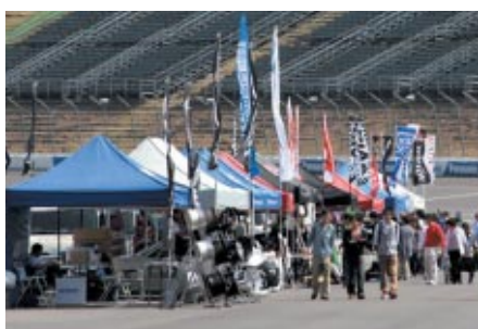
日本自動車用品・部品アフターマーケット振興会 (NAPAC) 加盟各社様のブースがパドックに出展され、展示・販売が行われました