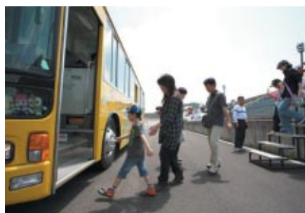
レースのインターバルにロードコースをバスでご体験いただいた「ロードコースバスツアー」