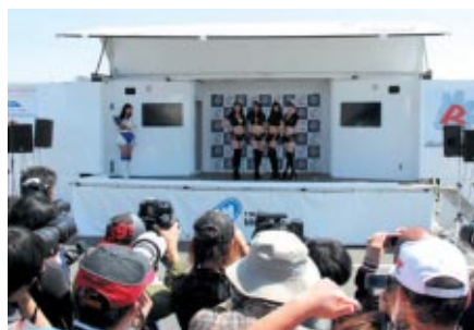
スーパー耐久公式ステージで華やかに開催された「ギャルオンステージ」がレースに華を添えました