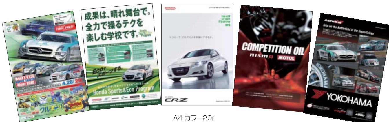
A4 カラー20p ※ 無料で配布いたしました。