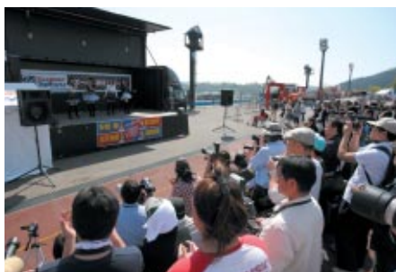
グランドスタンドプラザのスーパー耐久公式ステージで行われた「SCREW」のパフォーマンス