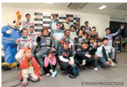
予選/決勝各日の記者会見に子どもレポーターを派遣、鋭い(?)質問を選手に聞いていただいた「記者会見子どもレポーター」