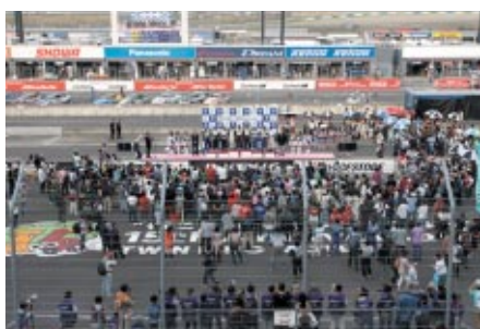
決勝レース終了後は、スーパースピードウェイコース上から表彰式をご覧いただきました