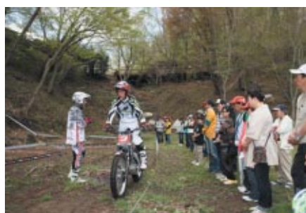
6月2・3日に開催される「トライアル世界選手権 日本グランプリ」に先駆けて行われた「トライアルデモンストレーション」