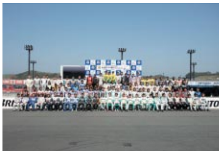
全ドライバーが参加してのフォトセッションが行われました