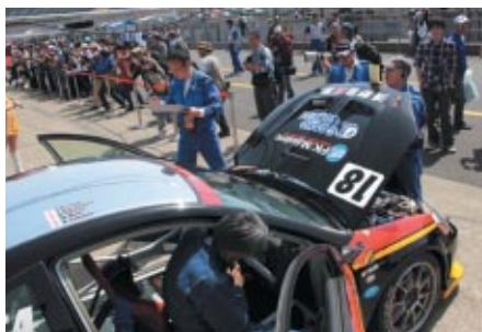
28(土)ピットウォーク時に行われた公開車検

大会期間は大型連休のスタートにもあたり、ファミリー連れのお客さまを中心ににぎわったツインリンクもてぎ。モータースポーツの魅力に触れていただける多彩なイベントや企画でお楽しみいただきました。