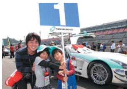
スタート前の各マシンをエスコートいただいた「グリッドキッズ」