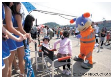
中学生以下のお子さまと保護者の方に無料でお楽しみいただいた「コチラレーシングのキッズピットウォーク」