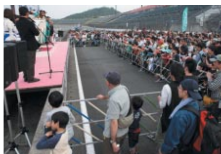
中学生以下のお子さま同伴のファミリーには表彰式を間近で楽しみいただきました