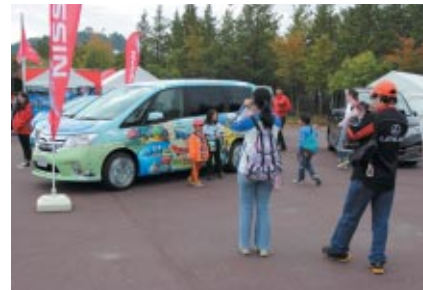
日産のニューモデル展示