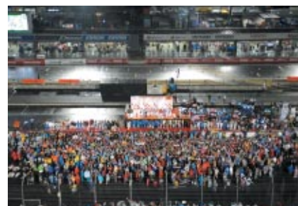
本大会の、そしてシリーズの最後は全ドライバーが登場しての「グランドフィナーレ」 お客さまとの集合写真はツインリンクもてぎ公式サイトよりダウンロードいただけます