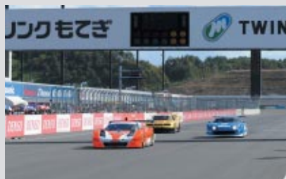
左から)2009 ARTA NSX 1998 ペンソオイル・ニスモGT-R 2002 エッソウルトラフロースーブラ

ツインリンクもてぎ開場15周年を記念して、SUPER GTで活躍した名車が デモンストレーション走行を行いました(27日<土> ロードコース)。