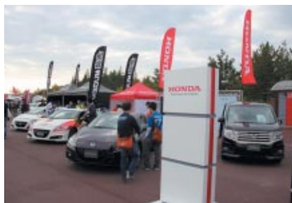
Hondaのニューモデル展示