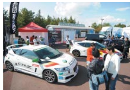
CR-Z 10 Litter Challengeマシンが展示されたM-TECブース