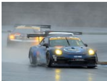
GT300クラス優勝 エンドレス TAISAN 911