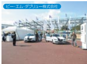
ビー・エム・ダブリュー株式会社