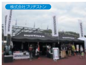
株式会社ブリヂストン