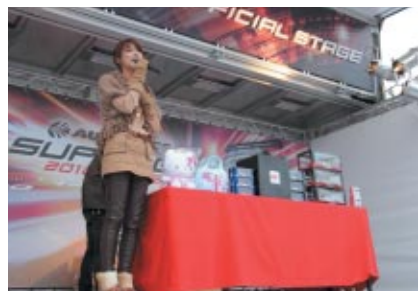
SUPER GTオフィシャルステージで行われた「KIDS抽選会」