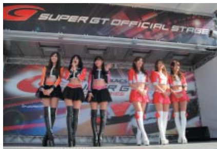
SUPER GTオフィシャルステージで行われた「スポンサーステージ」 各チームのキャンペーンガールが華やかに勢ぞろいしました