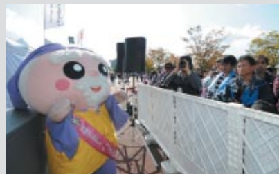
人気のゆるキャラ「ハッスル黄門」もPRに大活躍