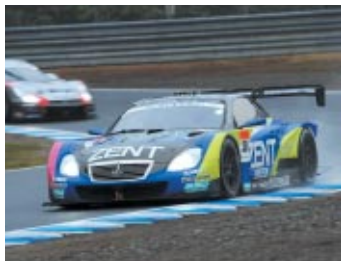
GT500クラス優勝 ZENT CERUMO SC430