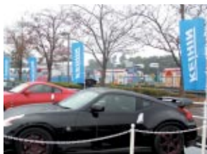
株式会社ケーヒン