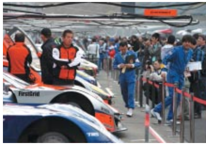
27(土)朝にビットウオークスタイルで行われた公開車換「オープンピット」