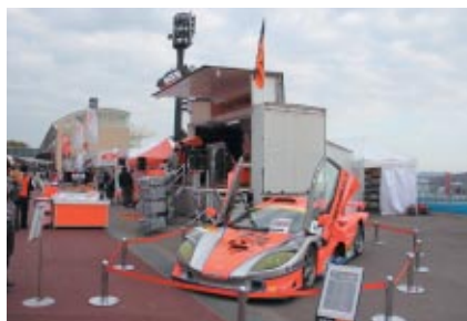
GT300マシン「ガライヤ」が展示されたオートボックスブース