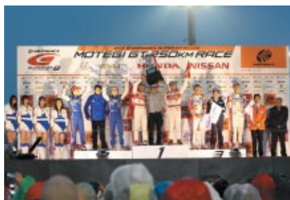
本大会の表彰式に続いてシリーズ表彰が行われました