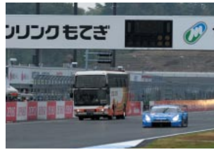
SUPER GTマシンが疾走するコースをバスで遊覧走行いただいた「サーキットサファリ」