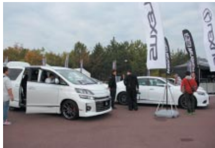
トヨタ自動車のレクサスニューモデル展示

国内屈指の人気を誇るSUPER GTシリーズが、今年もツインリンクもてぎで最終戦を迎えました。決勝日の28日(日)はあいにくの雨となりましたが、コース上はもちろん、グランドスタンドプラザ周辺を中心にパートナー各社様ブースやイベントで熱い週末となりました。