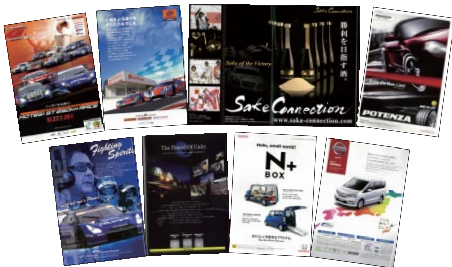
A4 カラー 80p 17,000部発行

株式会社アイデア 株式会社オートボックスセブン 株式会社カーグラフィック カルソニックカンセイ株式会社 株式会社三栄書房 住友ゴム工業株式会社 タカタ株式会社 トタル・ルブリカンツ・ジャパン株式会社 日産自動車株式会社 ブランドユース株式会社 株式会社プリチストン 本田技研工業株式会社 モーターマガジン社 横浜ゴム株式会社