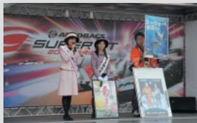
茨城の観光や物産を大使たちがアピール

PICK UP 1 SUPER GTオフィシャルステージを使って地元・茨城県のPRタイムが設けられました。