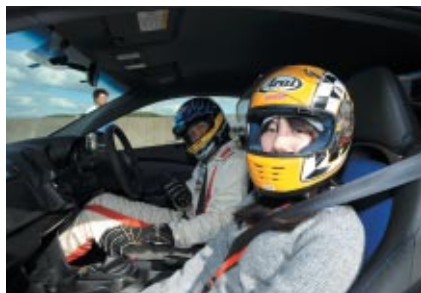
レーシングドライバーの運転するHonda CR-Zでロードコースを体験いただいた「サーキットエクスペリエンス」