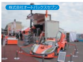
株式会社オートトップセブン