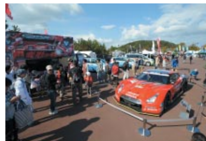
GT500 GT-Rが展示されたNISMOブース

PICK UP 1 SUPER GTオフィシャルステージを使って地元・茨城県のPRタイムが設けられました。