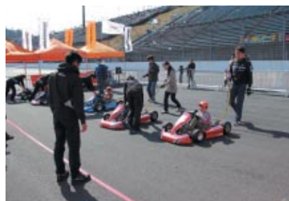
スーパースピードウェイ特設会場で行われた「KIDSカート教室」 親子でモータースポーツの原点に親しんでいただきました