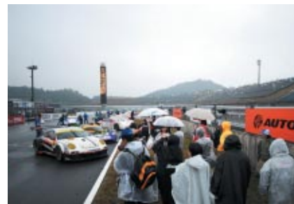
決勝レース終了後の車両保管を間近でご覧いただいた「パルクフェルメウォーク」