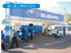
富士重工業株式会社

株式会社ETスクウェア【PR】 茨城県【PR】 株式会社M-TEC【PR・販売】 株式会社オートトップセブン【PR】 カルソニックカンセイ株式会社【販売】 クラリオン株式会社【PR】