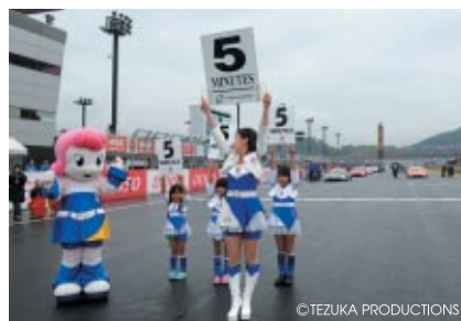
SUPER GT決勝スタート前にツインリンクもてぎエンジェルとともに スタート進行をお手伝いいただいた「なりきりエンジェルスベシャル!」 小学生女子3人が大活躍しました