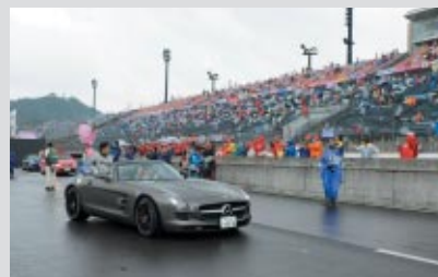
ファンの温かい声援の中、オープンカーに乗って ロードコースをパレード