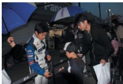
中学生以下のお子さまと同伴の方(お子さま1名につき2名まで) に無料でお楽しみいただいた 「トランスフォーマー×GTキッズウォーク」