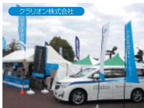
クラリオン株式会社