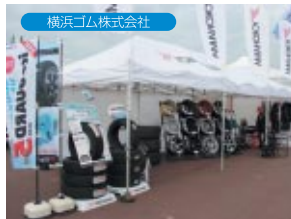
横浜ゴム株式会社