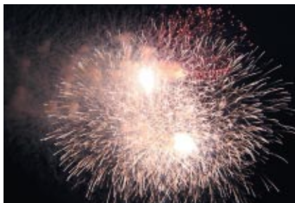
夜空を焦がす大輪の花火が打ち上げられました