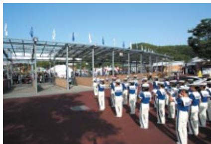
茨城県立太洗高校マーチングバンド「BLUE-HAWKS」の演奏で お客さまをお迎えしました