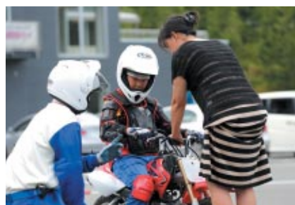
お子さまと保護者の方が一緒にバイクの操縦を楽しく学んでいただいた「親子バイク教室」