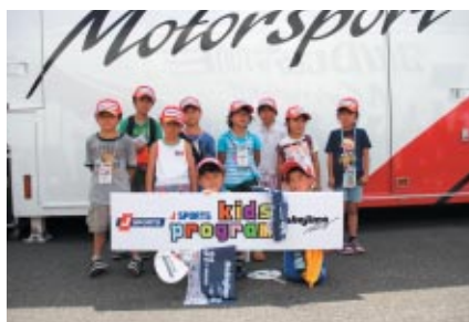
J SPORTSによる子どもたちのための企画「KIDS PROGRAM」 ブリヂストンのタイヤサービス見学やピット訪問を 体験いただきました