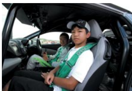
抽選で選ばれた幸運なお客さまに中嶋悟さん、道上龍選手、 武藤英紀選手のドライブするCR-Zの助手席でロードコース走行を 体験いただきました