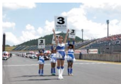
「なりきりエンジェルススペシャル～スタート前ボードを掲出しよう!～」に 登場したかわいいエンジェルたち