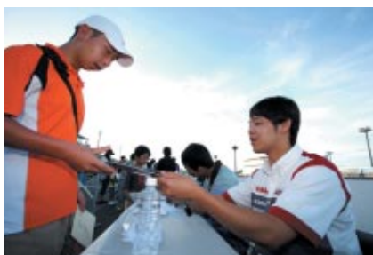
フォーミュラ・ニッポンドライバーはもとより、トップライダーら 豪華ゲストも加わっての「オールスターズスペシャルサイン会」