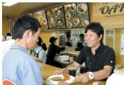
「憧れのライダー&ドライバー大集合」では、有名選手がレストランやモビパークなど、場内の様々な施設に登場し、ご来場のお客さまとの交流を楽しみました