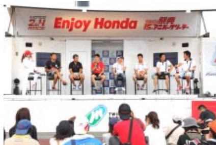
Honda Racingのトップドライバー・ライダーたちがモータースポーツの魅力を語りました

「みて」「遊んで」「感じる」をテーマに大会期間の二日間にわたって開催された「Enjoy Hondaもてぎ2012」。ツインリンクもてぎ場内をフルに使って多くのお客さまにHondaの魅力を感じていただきました。