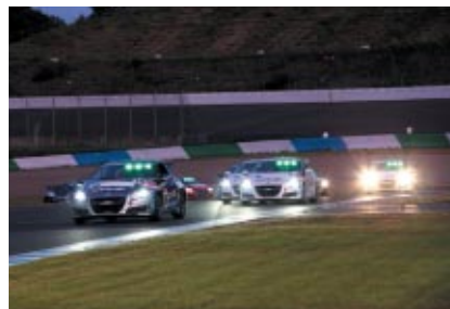
トークショー出演者を中心としたメンバーによる 「CR-Z 10リッターチャレンジオールスターレース」