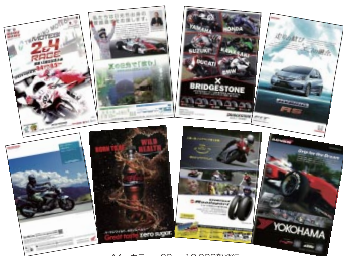
A4 カラー 60p 12,000部発行

株式会社アライヘルメット 株式会社三栄書房 住友ゴム工業株式会社 東京モータースポーツカレッジ 利根コカ・コーラボトリング株式会社 日光市 株式会社プリアストーン 本田技研工業株式会社 株式会社ホンダモーターサイクルジャパン ヤマゼンコミュニケーションズ株式会社 ヤマハ発動機販売株式会社 横浜ゴム株式会社