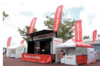
株式会社ホンダモーターサイクルジャパン