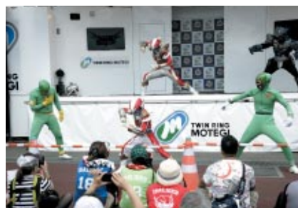
こちらはご当地ヒーロー大集合の楽しいステージ