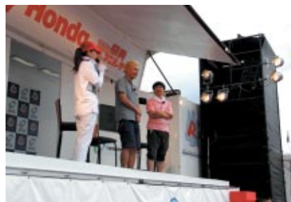
NEW STEP WGN「ススメ!家族の冒険プロジェクト」よしもとスペシャルステージに人気お笑い芸人の田村亮さん(中)と山崎邦正さん(右)が登場