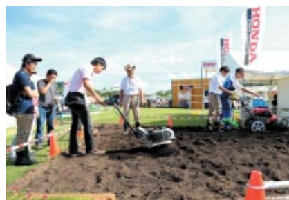
体験プログラムも豊富にラインアップされました 写真はミニ耕うん機を操作いただいたコーナー