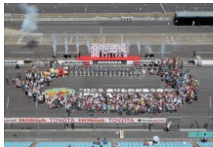
5日(日)昼には15thアニバーサリー記念セレモニーを実施 スーパースピードウェイを舞台にお客さまも加わっての記念撮影を行いました