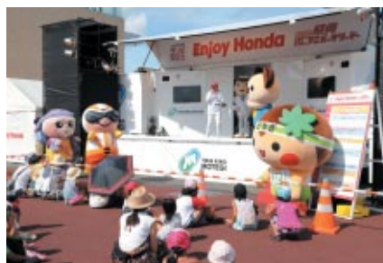
地元ゆるキャラが大集合したスペシャルステージ