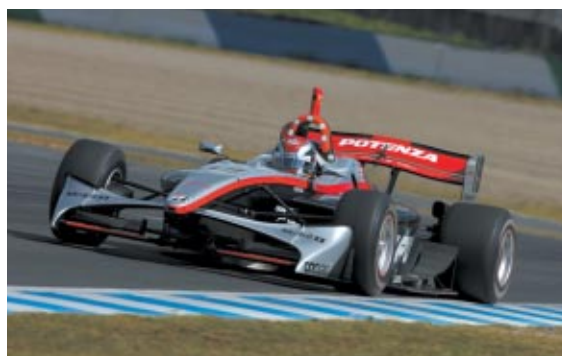
約1年ぶりとなる今季初優勝のJ.P.デ・オリベイラ