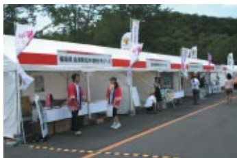
観光PRブース 栃木県・日光市・茨城県・会津若松市