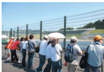
「激感エリア」(S字コーナー)