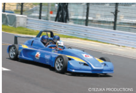
コチラレーシング会員 先着6名様をレーシングコースでのFE-810同乗体験にご招待