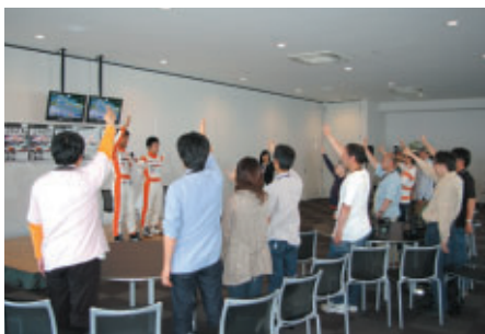
サイン入りプロマイドをかけて 「TEAM TETSUYA」のドライバー2人とジャンケン大会 (ホスピタリティラウンジ)