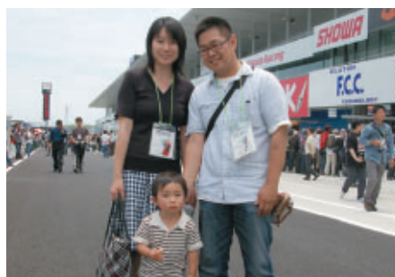
県内よりお越しのお客さま 「初めてレース観戦にきました! ピットウォーク楽しみです!!」