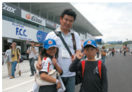
7日(日)のFE-810同乗体験を楽しみにされていた コチラレーシング会員のお客さま ピットウォークを満喫!