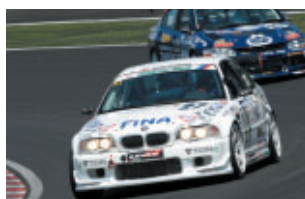
ST-3 FINA ADVAN M3