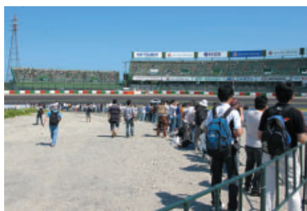
「激感エリア」(1コーナー~2コーナー)