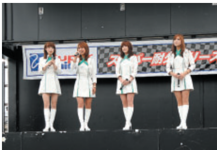
鈴鹿サーキットクイーンによるトークステージ (GPスクエア)