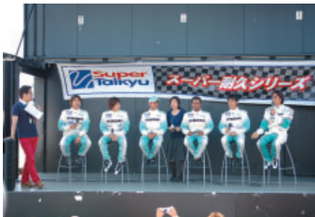
第2部には「PETRONAS SYNTIUM TEAM」ドライバー 6人がトークショーに登場 (GPスクエア)