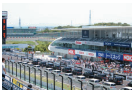
ピットウォーク中に行われたステップワゴンによるパレード