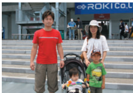
名古屋市からお越しのお客さま ご家族揃ってのご観戦です