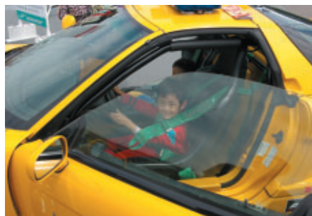
コチラレーシングブースではマーシャルカーNSXの搭乗体験も行われました (グランプリスクエア)