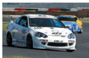
ST-4 HONDA CARS東京μSSR DC5