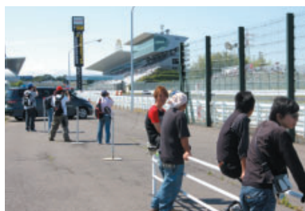
間近でマシンの走りをお楽しみいただける「激感エリア」(ストレート~1コーナー)