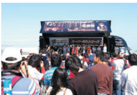
大勢のお客様で盛り上がったレースクイーンオンステージ (GPスクエア)