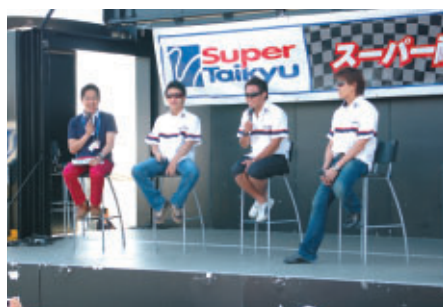
7日(日)に行われたドライバートークショー 第1部には「TEAM 5ZIGEN」の3人が登場 (GPスクエア)