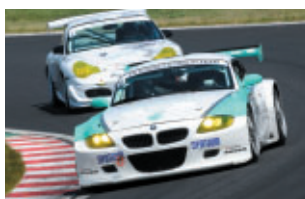
ST-1 PETRONAS SYNTIUM BMW Z4M COUPE