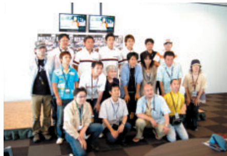
ホスピタリティラウンジ購入者にはドライバーが特別訪問 「TEAM 5ZIGEN」のドライバー3人と記念撮影 (ホスピタリティラウンジ)