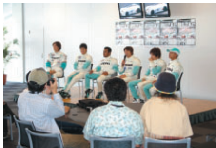
最後は「PETRONAS SYNTIUM TEAM」ドライバー6人が登場 レースの見所を語っていただきました (ホスピタリティラウンジ)