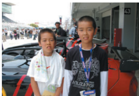
ピットウォーク中、熱心にマシンを観察していたお二人は 「兄弟そろってS耐のファンです!」