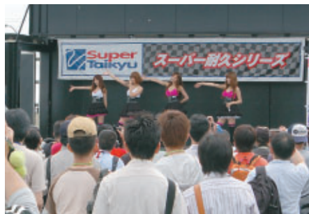
トーク&ライブが行われた スーパー耐久イメージガール「JUICY」のオンステージ (GPスクエア)