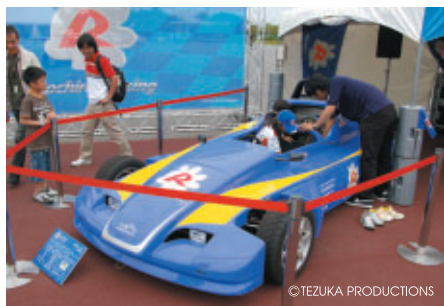
FE-810の搭乗体験が行われたコチラレーシングブース (GPスクエア)