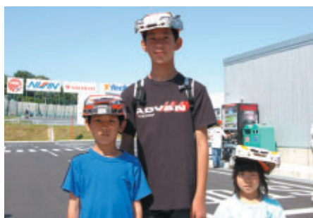
オリジナルのペーパークラフト帽子が 見るからにS耐ファンのごきょうだい マシンをかたどった帽子にはしっかりとドライバーのサインが!