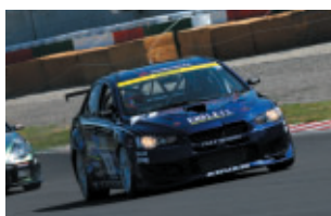
ST-2 ENDLESS ADVAN CS-X