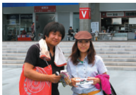
名古屋市からお越しのお客さま 「今日のS耐楽しみにしていました!」