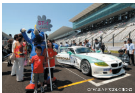
7日(日)にはコチラレーシング会員3名様にグリッドキッズを体験していただきました